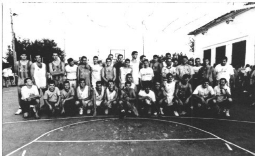
El conjunt de participants

El partit començà a les 18 h. 27 m. del dia 26 i acabà a les 20 h. 23m. de dia 27, moment en què sonaren unes traques indicant que el rècord Guinness ja era al Pla de na Tesa i les més de cinc centes persones que omplien la pista aplaudien aquesta gran gesta guanyada a pols pels 24 jugadors.