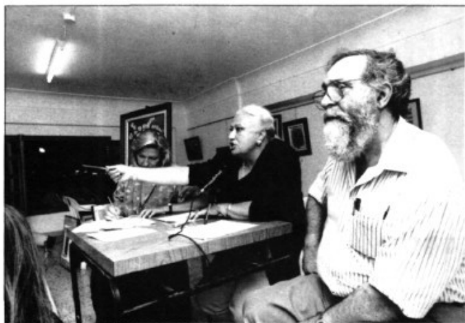
Un moment de la subhasta

amb tanta mala sort que va caure d'esquena sofrint, segons el diagnòstic mèdic, un traumatisme craneal, dos hematomes cerebrals i distintes contusions. Després d'estar uns dies en coma ja no es va poder recuperar. Des d'aquí volem fer arribar el condol a familiars i amics esportistes.