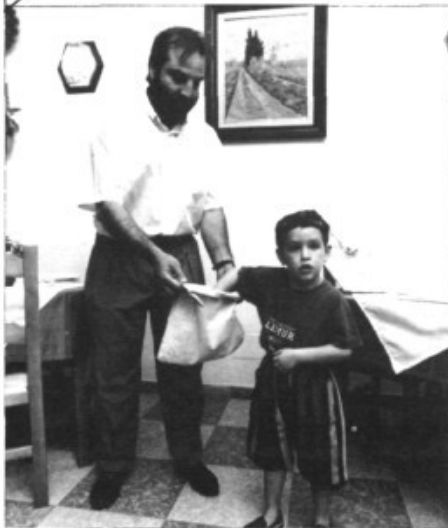
L'extracció de les paperetes durant el segon sorteig

Viatges Marratxí té organitzat per a la propera tardor un fabulós viatge a Salvador de Bahia, Brasil , i els lectors de Pòrtula tenen una oportunitat única d'anar-hi amb Viatges Marratxí . Del 20 al 27 d'octubre, els meravellosos paisatges de Salvador de Bahia esperen als marratxiners i als mallorquins. Per 85.000 ptes podeu passar una setmana de somni en un hotel de quatre estrelles a una de les platges de moda de més fama mundial. I si cercau la ventura hi podreu anar gratuïtament. El setembre tindrà lloc el sorteig estrella i si ja teníeu la vostra reserva feta Viatges Marratxí vos abonarà el seu import. No espereu més. Cercau la ventura i anau al Brasil amb Viatges Marratxí i Pòrtula . ■