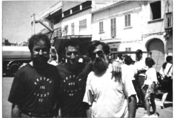
Alguns dels organitzadors durant les festes de l'any passat

A les 20,30 hores inauguració de l'exposició de fotos antigues