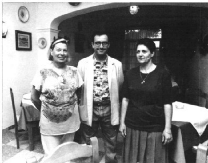
Els testimonis del segon sorteig