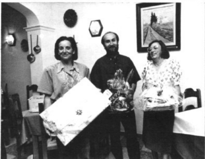
Els guanyadors del primer sorteig amb els premis