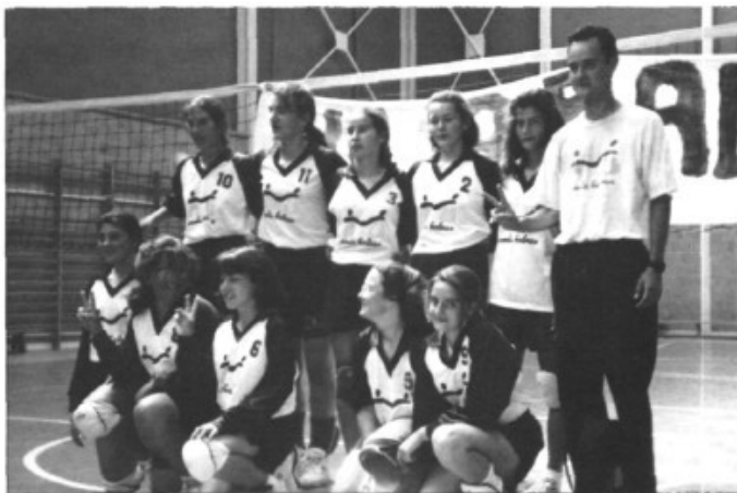
Aula Balear, equip campió

Començarem amb un dels esdeveniments importants del mes. Del 9 al 13 de juny al recentment inaugurat Polisportiu Costa i Llobera de Pòrtol se jugaren les finals de voleibol escolar de Balears en la categoria infantil femení, organitzats per la Conselleria de Cultura, educació i esports i amb la col.laboració de l'àrea de Cultura i esports de l'ajuntament de Marratxí. Els equips finalistes