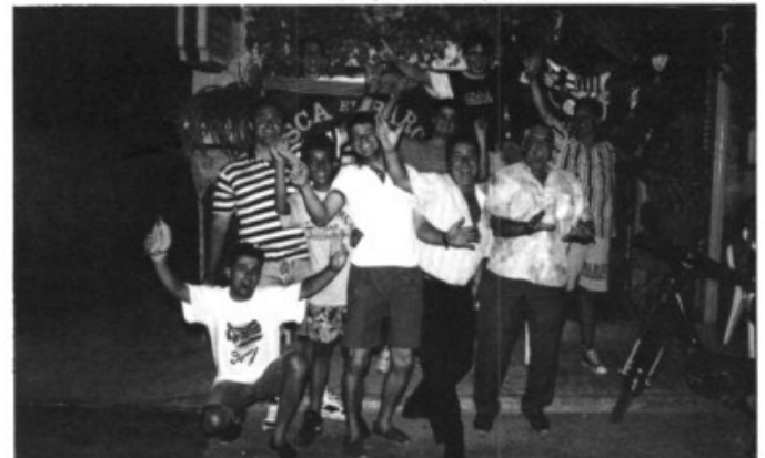
La penya Can Marçal celebrant el títol del Barça