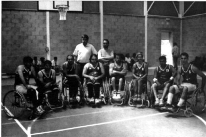
L'Equip de bàsquet Illes

l'esport marratxiner, amb la col·laboració de l'ajuntament de Marratxi.