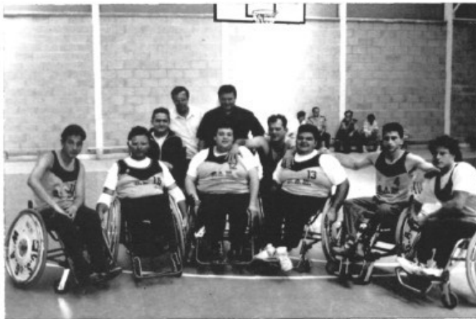
L'equip G.A.M. de Badalona