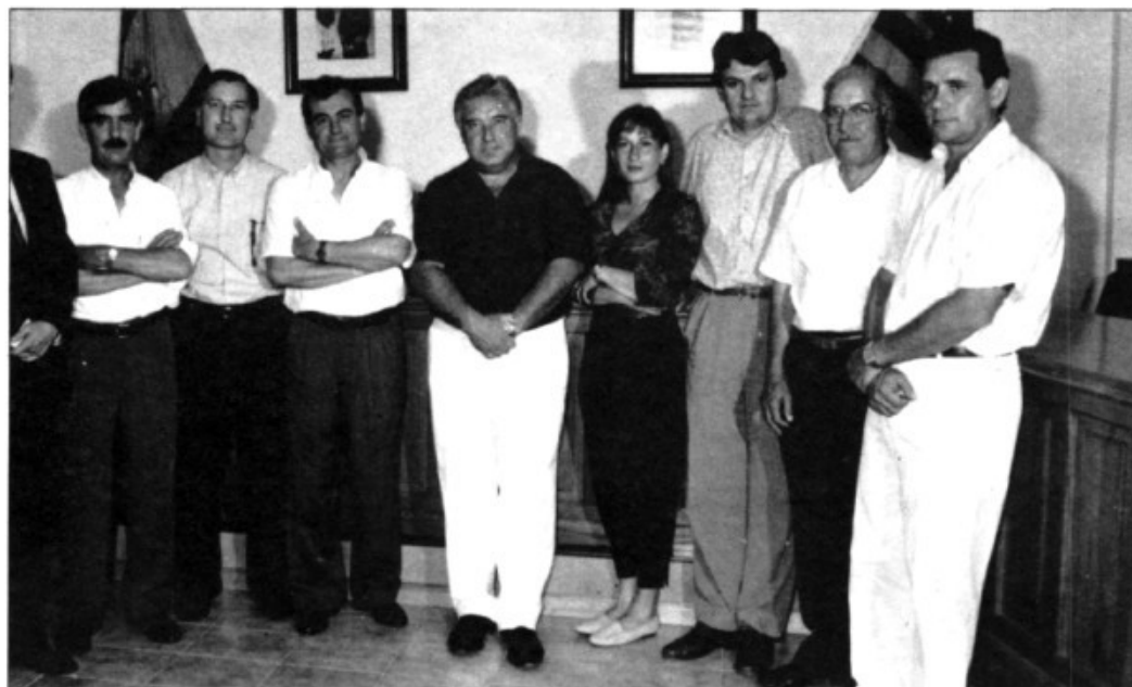
L'equip municipal de govern

i culturals del terme, es nostre programa pretén la creació d'una GERENCIA DE CULTURA I ESPORTS per a coordinar i organitzar totes les seves activitats dels Clubs i Societats Esportives, Activitats escolars, Campaments, Clubs juvenils, Col.laboració APAS.."