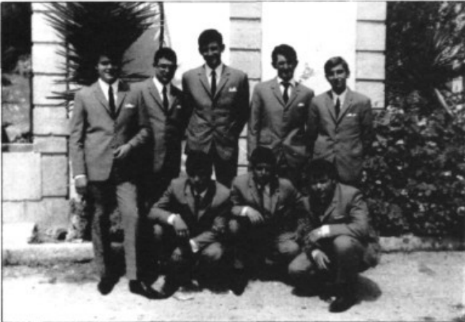
La foto oficial amb el traje nou, davant el pou de l'església

Els Quintos de l'any 1968 (que anaven a files l'any següent) recorden amb molta nostàlgia els vint-i-cinc anys d'aquelles festes que ells varen organitzar.