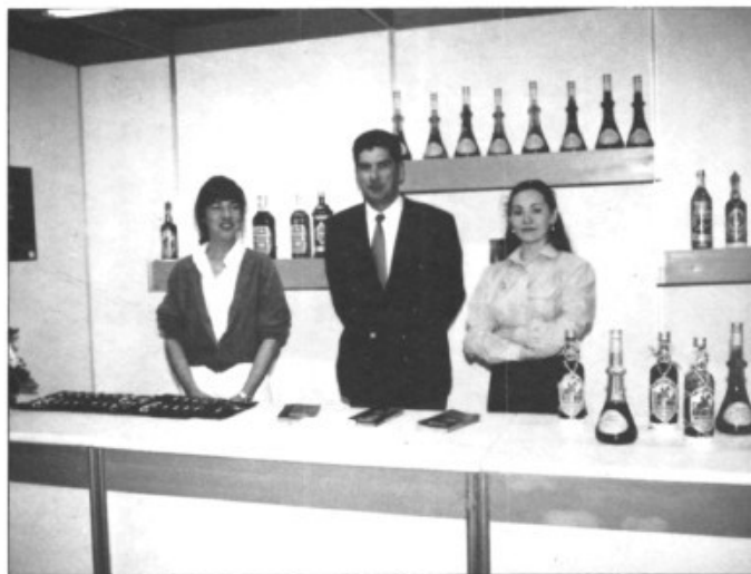
Associació de Licorers / Limsa