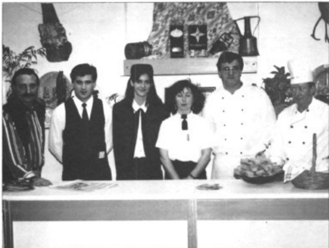
Restaurant Tío Pepe