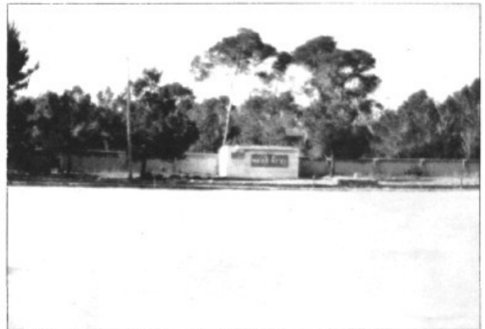
Una visió que canviarà molt

Amb un pressupost de 22.699.291,- Ptes. l'Ajuntament ha demanat la inclusió dins el pla territorial d'equipaments esportius de Mallorca per 1.993 de la segona fase dels vestidors del camp municipal de son Caulelles. Aquesta obra que estarà emmarcada