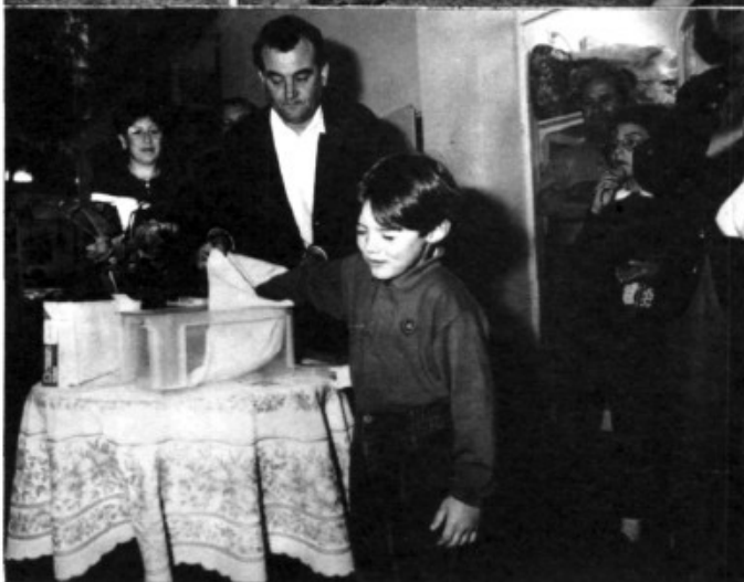
Tres moments del primer sorteig a les Galeries Comercials del Pont d'Inca