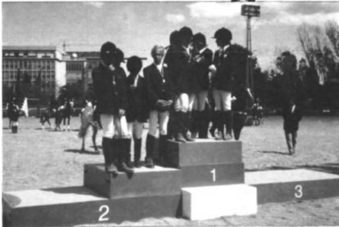
La selecció balear al podium