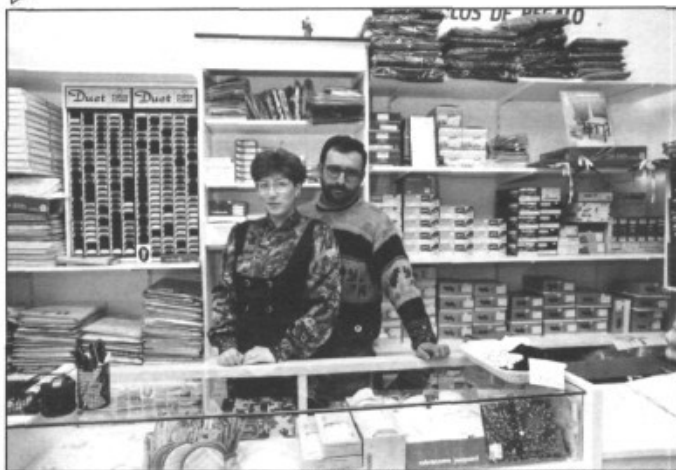
Xisca i el seu marit.