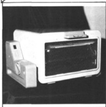
FORN ELÈCTRIC MAGATZEMS VERDERA C/ Major 87 / Tel. 60 21 02 PÒRTOL