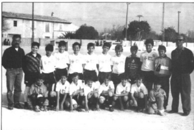
L'equip benjami segon classificat del torneig