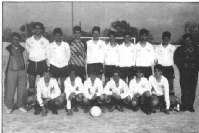
Els cadets del Pla de na Tesa