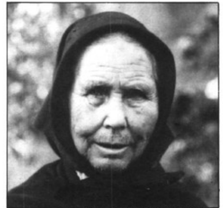
Dona vella de Pòrtol (1928)

L'agafa per la mà blanca, dalt la cambra la'n pugé. -Vols-me dir tu, esposa mia, es botons d'or que et vaig fer? -Demana-ho a mia sogra, que sa fia en fa femer. -Vols-me dir tu, esposa mia, el poal d'or que et vaig fer? -Demana-ho a mia sogra, que sa fia en fa femer.