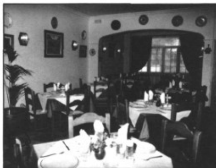
SOPAR PER A QUATRE PERSONES RESTAURANT CAN LLORENÇ C/ Principes de España / Tel. 60 29 06 ES FIGUERAL