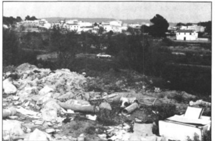
Els fers acumulats als voltants del Polígon ajuden a fer la zona més africana