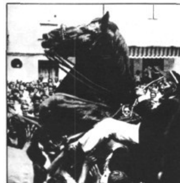
2 PERSONES FESTES DE SANT JOAN DE CIUTADELLA VIATGES MARRATXÍ Antoni Maura, 6 / Tel. 79 54 83 ES PONT D'INCA