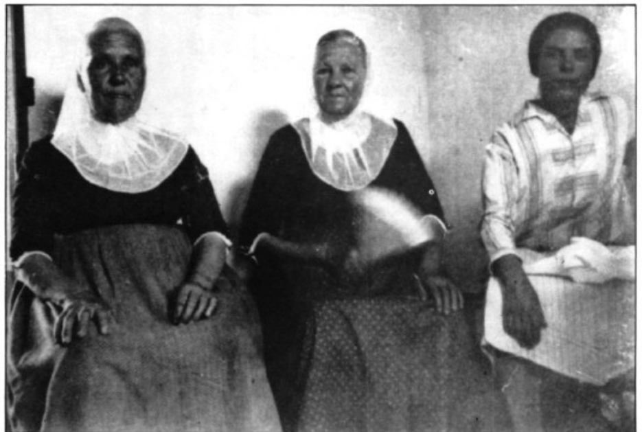
Aigunes de les cantadores de Pòrtol (1928)

-Aixeca't, trutja vellaca, que es porcs ja van pes carrer. Primer hi 'nira vostra fia que no hi 'nirà ma muller. -Aixeca't, trutja vellaca, que has jagut amb cavaller. -Si vós no fósseu mu mare, un foc en faria fer, per la muntanya més alta 'niria a ventar es cenrer. Si vós no fósseu mu mare, que a mi em donàreu el ser, sabeu com poria esser que no la'm pagàsseu cara? Però no s'és colgat encara qui mala nit ha d'haver. ■