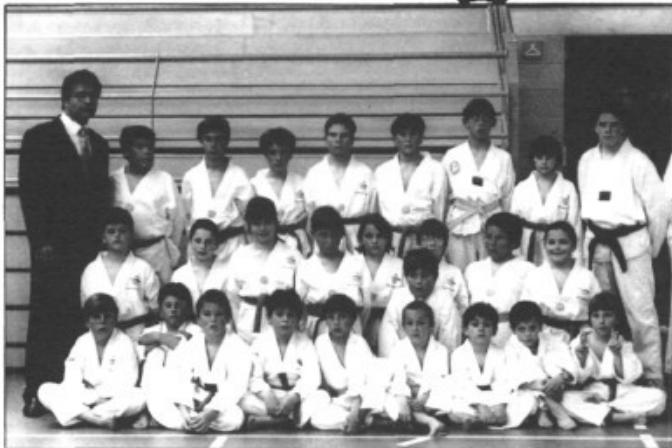
L'ESCOLA DE TAEKWONDO RAFEL OLIVER DE PÒRTOL EN CATEGORIA INFANTIL PARTICIPA A L'EXHIBICIÓ INFANTIL DE TAEKWONDO AL PAVELLÓ ESPORTIU DE LLEVANT DE PALMA

El passat dia 20 d'abril es celebrà en el pavelló esportiu municipal de Llevant de Son Gotleu de Palma el segon campionat Internacional de Taekwondo entre Balears i Korea (campiona del món), amb una gran assistència de públic, que demostra la gran acceptació que té dia a dia aquest esport a Mallorca.