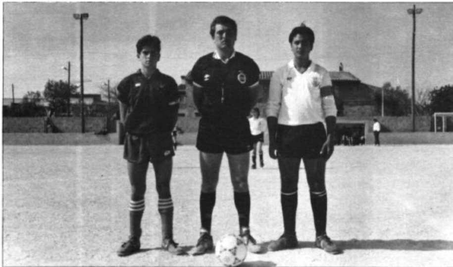
Els capitans i l'àrbitre