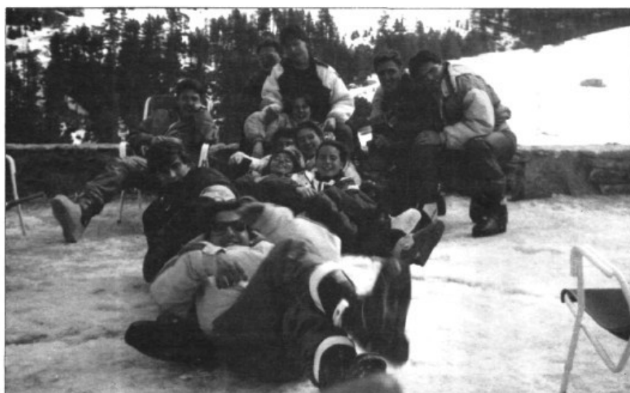
Durant el passat viatge a la neu

de na Tesa ho va fer en 5è. Aquest va quedar a un sol pas d'aconseguir la classificació per al play-off d'ascens, però un mal partit a la darrera jornada, davant el Felanitx, ho va impedir.