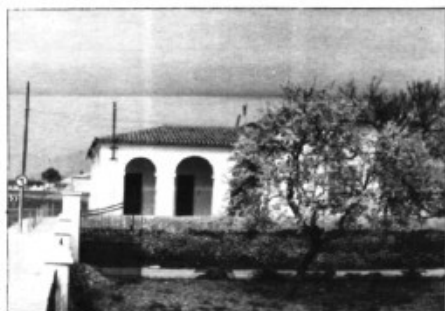
L'anomenada escoleta des Pla de na

Tesa, que fins ara tenia les seves depenències al Centre Janer Manila, ha canviat la seva ubicació. Aprofitant les millores dutes a terme per l'Ajuntament al Convent de Ca Ses Monges, hom ha habilitat un lloc per aquests nins d'entre un i tres anys que acudeixen a l'Escoleta.