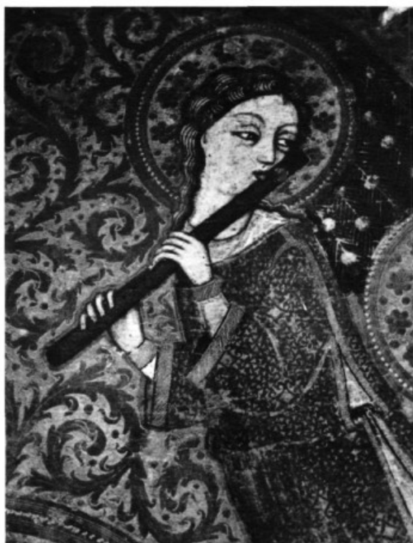
FOTOGRAFIA TOLO AGUILAR

CASA DE CULTURA "S'Escorxador" Carretera Sa Cabaneta - Portol, s/n.