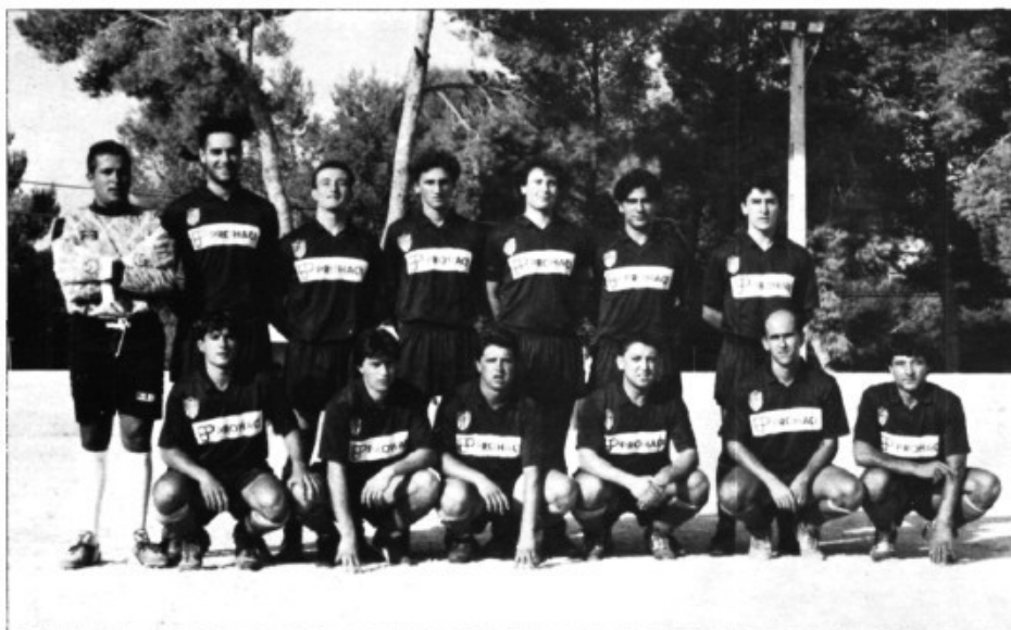
El Marratxí, equip millor classificat

L'equip esporlerí no guanyà al Marratxí, sinó que fou el Marratxí el que perdé el