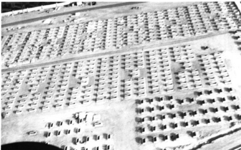
L'impactant futur de Marratxí ("Bon Sosec" des de l'aire)

amb una sèrie de casos que s'amplia dia a dia. Ni tansevilla sabem com quedaran les minvades contraprestacions oferides inicialment. Amb tot, ens queda una possibilitat. Encara que no se n'ha sabut res més i no coneixem l'estat actual del seu procés ens queda l'esperança del recurs de reposició presentat pel PSOE-Marratxí el passat abril contra la llicència d'ampliació d'obres.