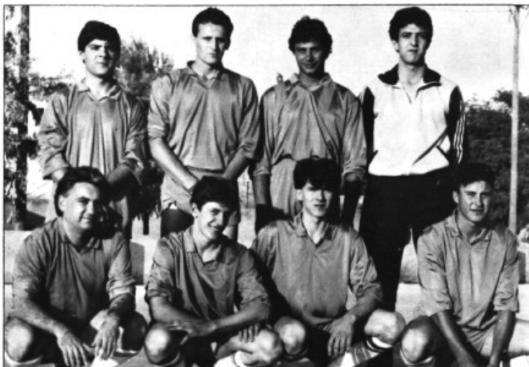
S'Esclat, equip campió

El Trofeu a l'esportivitat el s'enduguè l'equip del Marrakeshi.