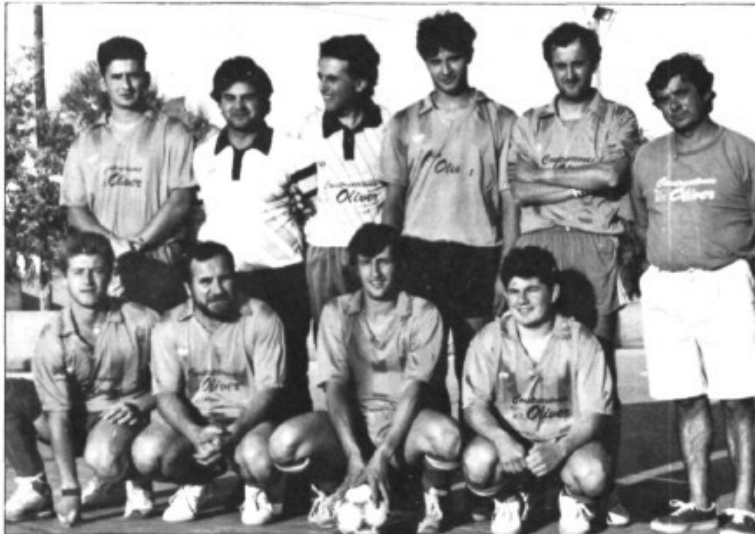
Construccions Oliver, tercer classificat