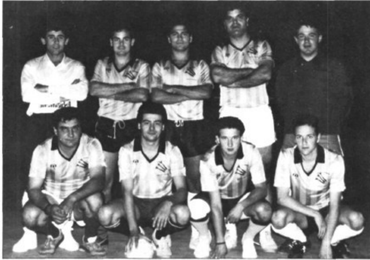
El Pont d'Ircia, subcampió