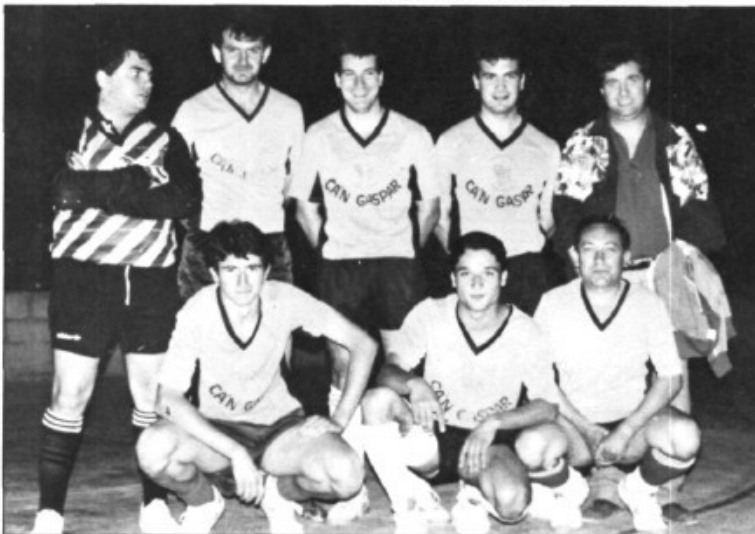
Ca'n Gaspar, quart classificat