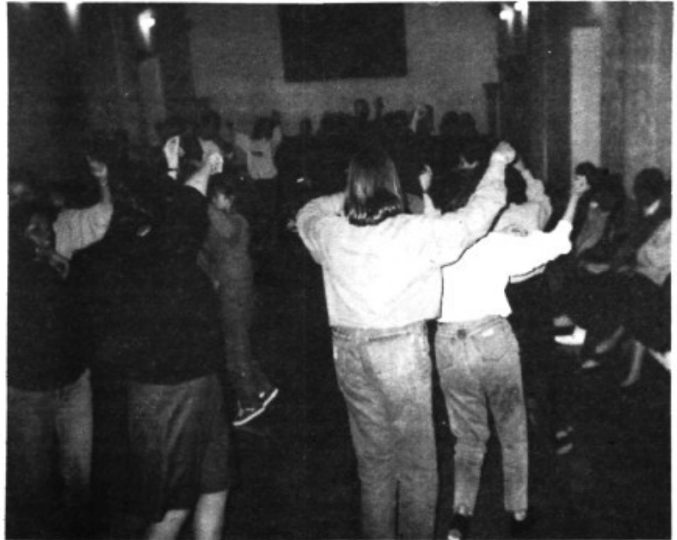
TOTS SANTS A MARRATXI.

El grup de Ball de Bot " Aires del Pla de Marratxi", que té la seva seu al Pla de Na Tesa, enguany ha complert els seus primers deu anys d'existència i per tal de celebrar-ho es varen reunir a un sopar de germanor al Monestir de Montision a Porreres. Després del sopar es va celebrar una petita festa entre tots els assistents a l'acte.