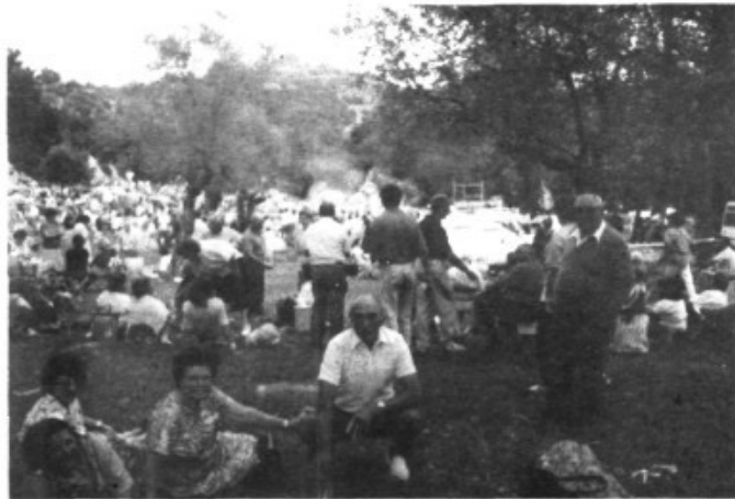
Volem agrair públicament a na "Maravillas", la cession d'aquestes fotos.