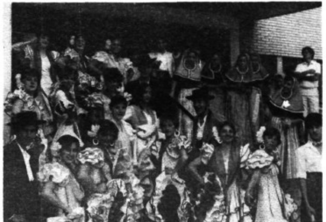
Al festival de Burgos, 1985. Els qui van vestits d'andalusos són els mallorquins. S'havien intercanviat els vestits amb el grup de Màlaga.

"Quan et necessiten per alguna cosa et cerquen, quan no t'han de menester no se'n recorden si existim"