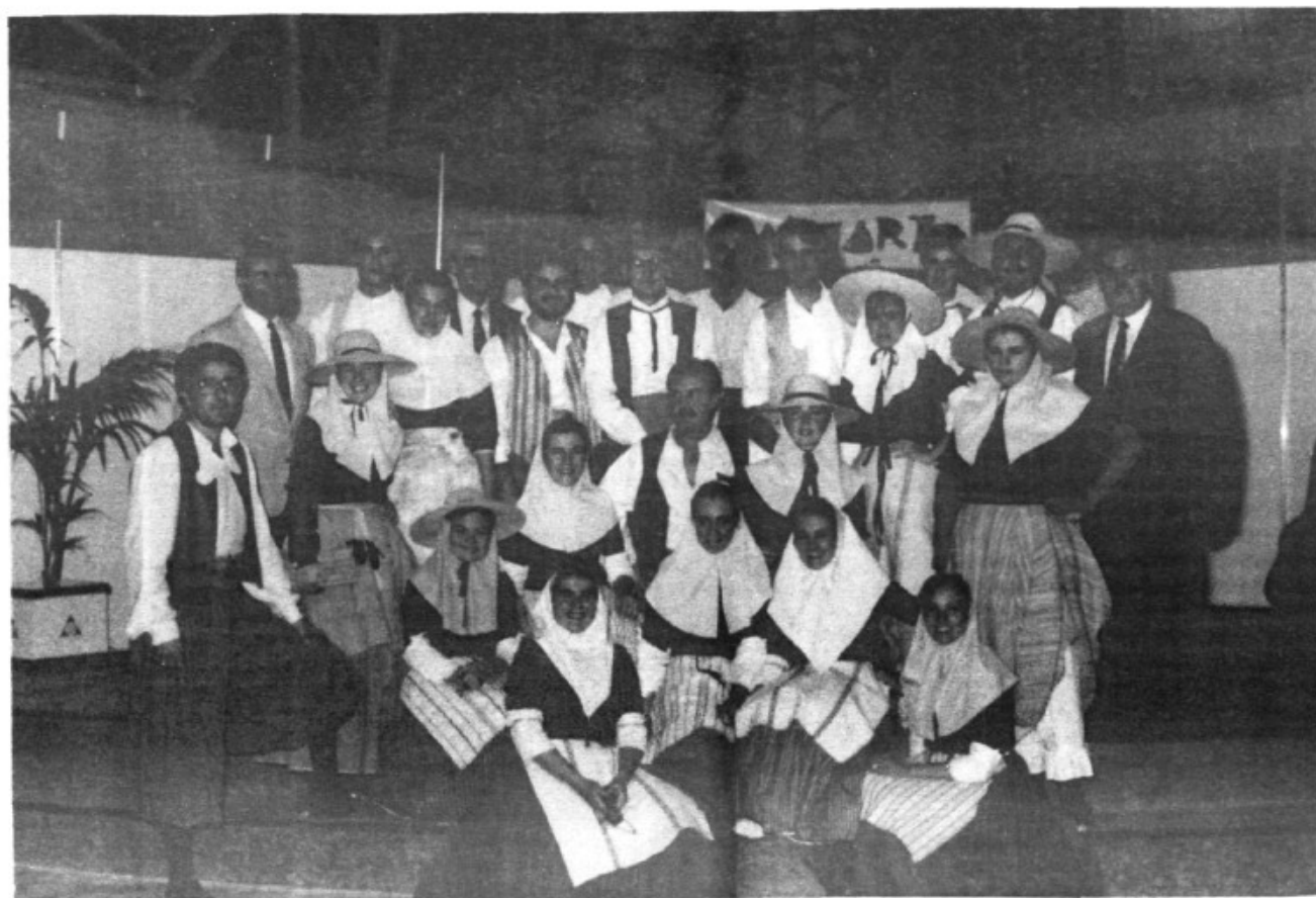
A la fira d'art i artesanía amb algunes autoritats de Marratxí.