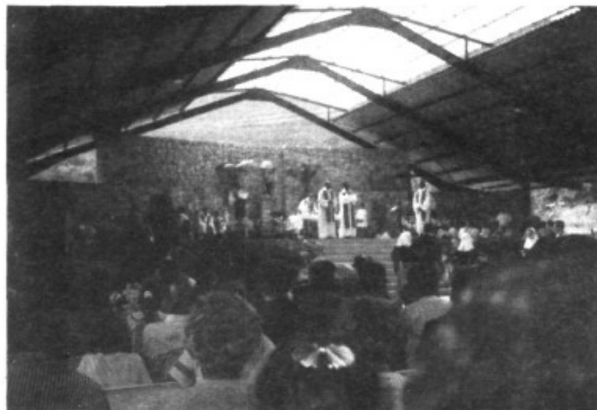
Una vista de la Missa concelebrada a l'acolliment dels pelegrins de Lluc.