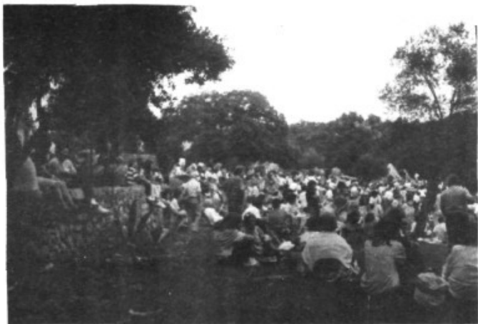
Dues vistes de la quantitat de Marratxiners que acudiren en romiatge a Lluc, a l'espera del dinar.