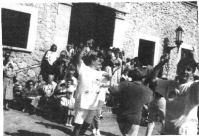
El poble marratxiner es diverteix i balla.