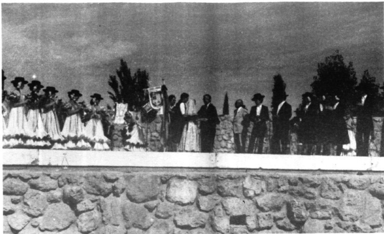
El primer viatge del grup. Còrdova, 1982