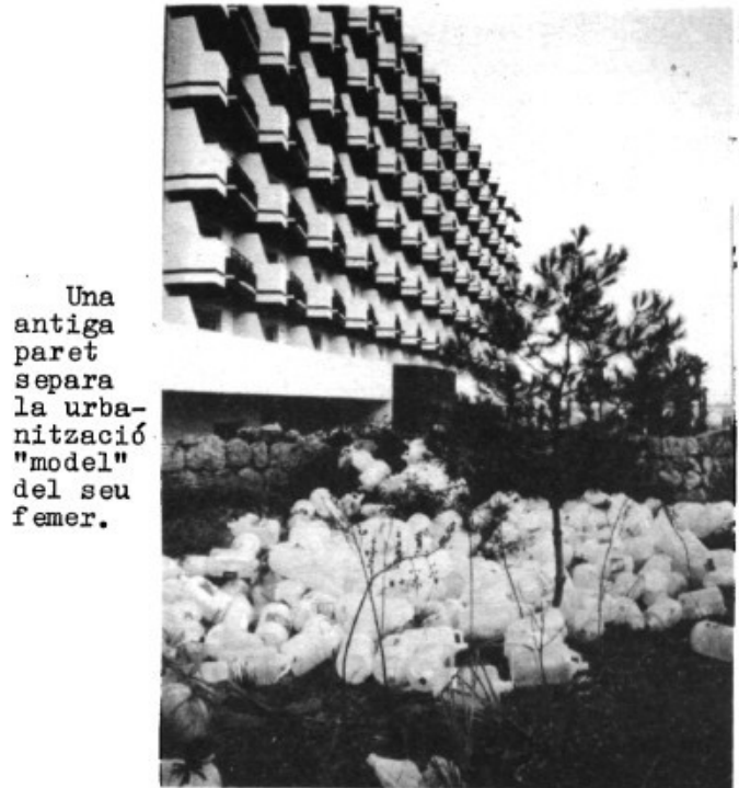
Una antiga paret separa la urbanització "model" del seu femer.

de les grans tales carboneres, tenen el verduc constant dels incendis. Qui visita el lloc devastat per l'incendi, vos assegura que ha de sentir la major tristesa si té l'ànima i els ulls en bones condicions d'ús. Ha mort alguna cosa més que uns arbres. Morí una part de l'esperança.