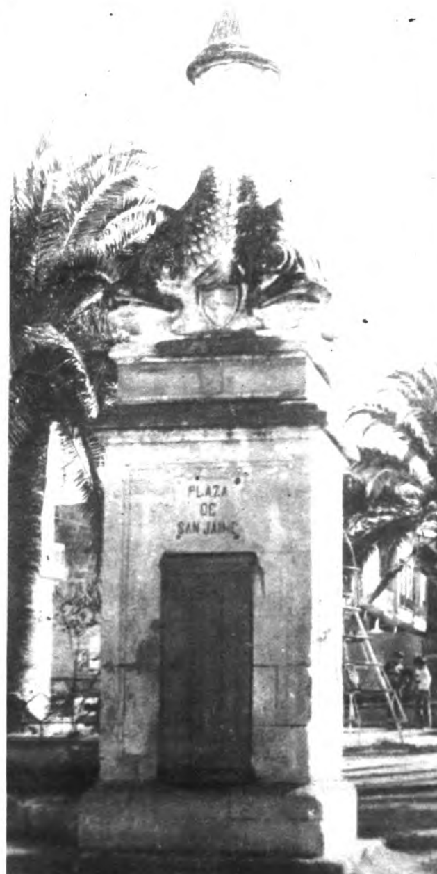
La Fuente y su estanque circular inmediato, con este pilón central cruzado por dos hierros que uno no sabe hasta cuando van a estar así, probando la incuria, el abandono y la absurda falta de gusto.

A ora no creemos que el pueblo reclame cosa alguna, y, posiblemente, tanto le de si la fuente cae como si no cae. Hemos visto "caer" tantas cosas en este Manacor, que una más no iba a suponer trauma alguno, puest que ya andamos inmunizados contra la historia, la estética e incluso la herencia de nuestros antepasados, que sí se preocuparon para conseguir una ciudad más habitable. Por otra parte, Comisiones no nos faltan que teóricamente cuiden de estas cosas, y que cualquier día, en vez de zancadillearse, insultarse y ofenderse, quizás se acuerden de que existe una Fuente llena de cochambre, descuidada y triste, y decidan adecentarla un poco, siquiera para que no digan.