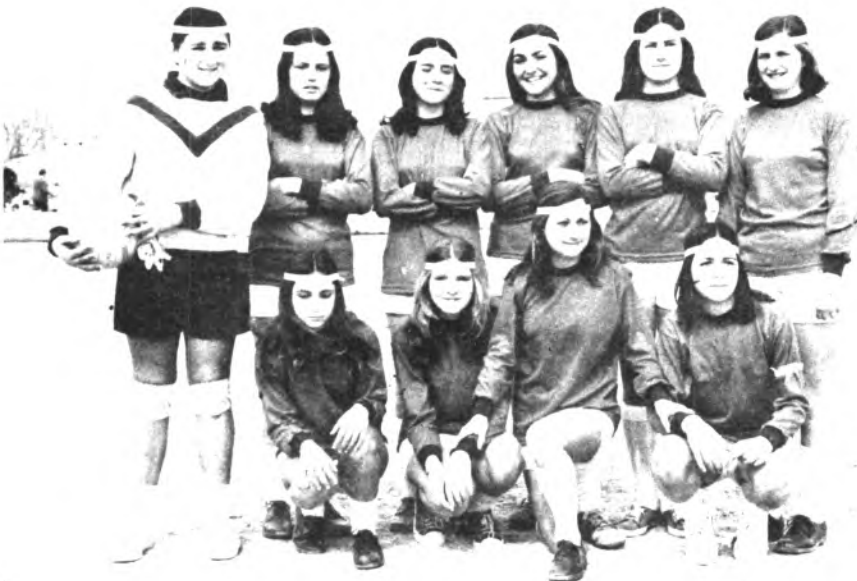
Los dos equipos de La Pureza.