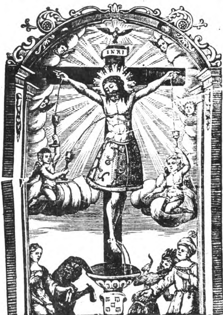
ANTIGUA XILOGRAFIA MALLORQUINA DE LA IMAGEN DE "LA SANG"

Hemos gritado mucho contra el autoritarismo eclesiástico. Ahora que se van abriendo cauces democráticos de colaboración comunitaria, ¿seguiremos instalados en nuestro cómodo mutismo para seguir disfrutando del privilegio de murmurar destructivamente?.