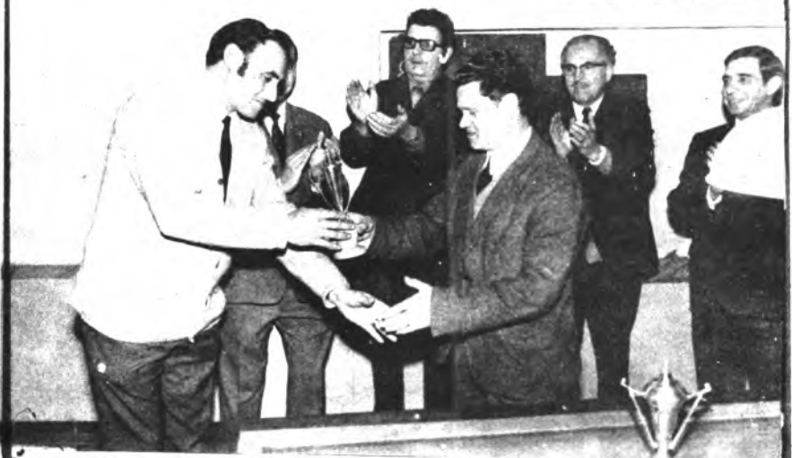
El Presidente Sr. Sureda entrega el trofeo del Club.