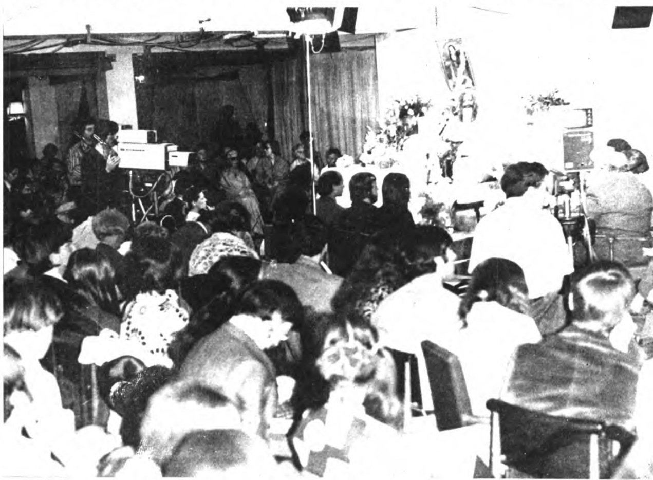
El Salón de Lectura del Hotel Castell de Cala Millor durante nuestra entrevista con el Maharishi

MAHARISHI. - Algo que reposa en lo más recóndito de nuestro ser, y, no obstante, constituye nuestro propio Ser, nuestro Yo absoluto e inalterable por naturaleza. La