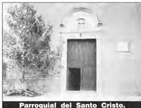
Parroquial del Santo Cristo.

La fiesta parroquial de los Maitines fue adelantada a las 21 horas. Las inclemencias de la época invernal, la