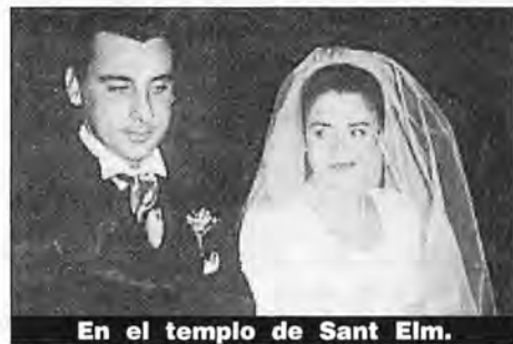
En el templo de Sant Elm.