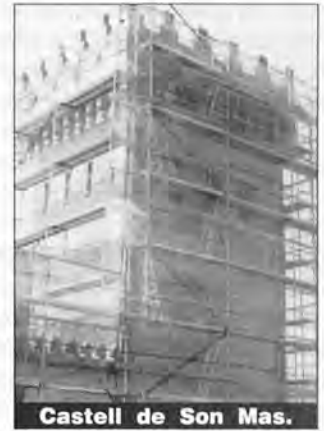
Castell de Son Mas.

En lo que respecta al Castillo, se han derruido los gruesos muros del aljibe, donde, con la estructura de bóveda nueva, se instalarán la sala de plenos y una de exposiciones. En la torre del Castillo se ha cambiado el forjado de la cubierta. En la parte baja se han sustituido los forjados en mal estado. En la planta primera se ha quitado la madera