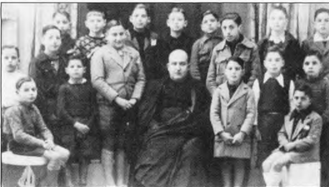
Un grup d'alumnes de s'Arracó devers l'any 1.939.