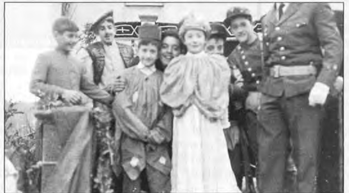
Una funció de teatre dels Reis a s'Arracó, l'any 1.965.