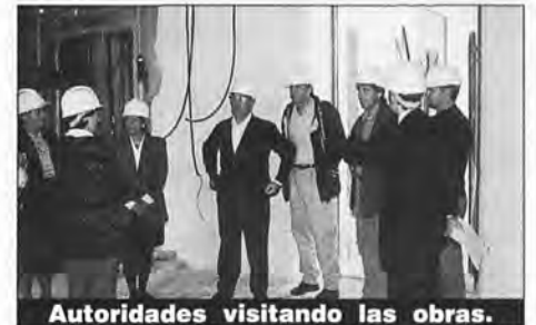
Autoridades visitando las obras.

El presupuesto total de las obras supera los 500 millones de pesetas y se espera poder inaugurar el nuevo Ayuntamiento en las fiestas de San Pedro de este mismo año que acabamos de empezar.