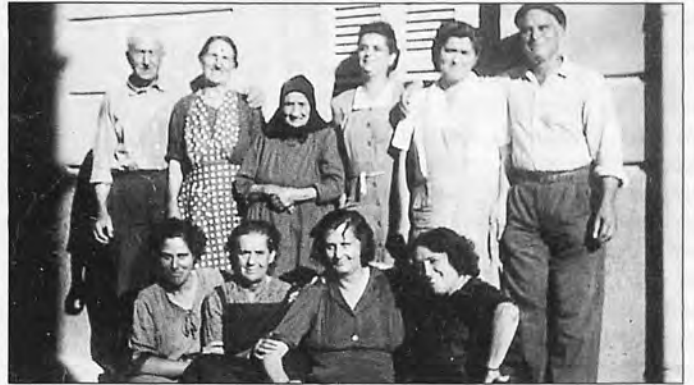
Els veïns del carrer Nou de s'Arracó, l'any 1.960.