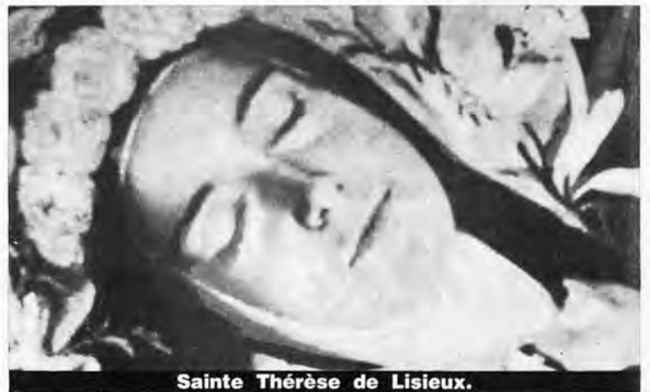
Sainte Thérèse de Lisieux.