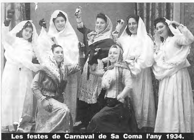
Les festes de Carnaval de Sa Coma l'any 1934.