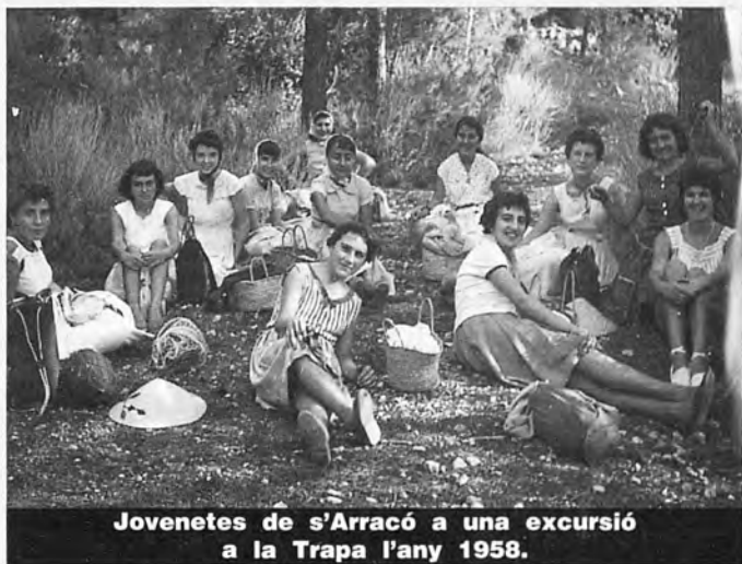
Jovenetes de s'Arracó a una excursió a la Trapa l'any 1958.