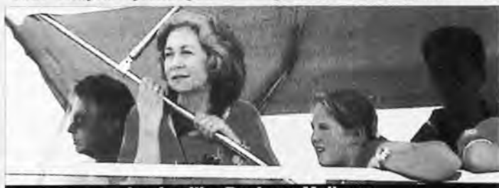
La familia Real en Mallorca.

cinéma, de la télévision, de la politique, des arts, ou simplement de la Jet-set; nous a fait beaucoup de publicité gratuite. Plus importante encore, la fidélité de la Famille Royale à Mari-vent, fait à Majorque une publicité d'une valeur incal-