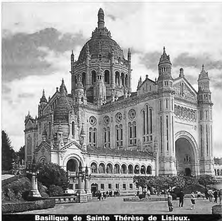
Basilique de Sainte Thérèse de Lisieux.

...Cette extase dura à peu près l'espace d'un Credo, et elle rendit le dernier soupir.