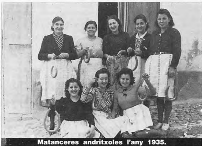
Matanceres andritxoles l'any 1935.