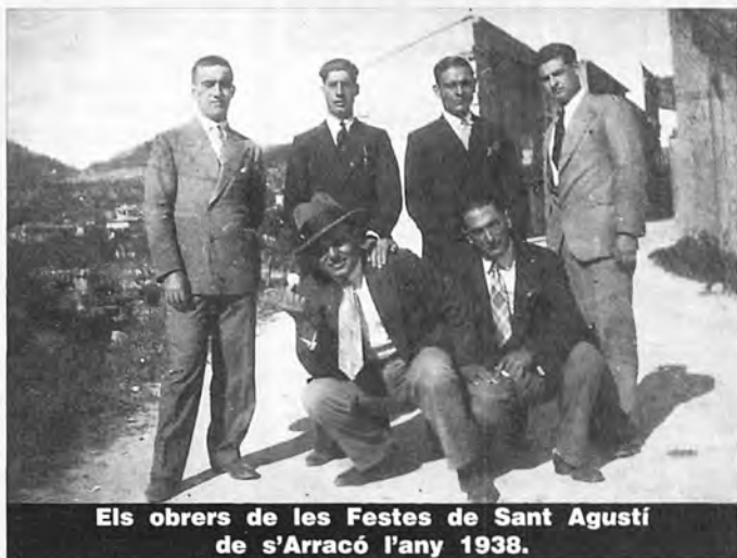
Els obrers de les Festes de Sant Agustí de s'Arracó l'any 1938.