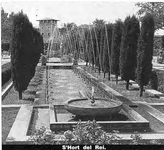
S'Hort del Rei.

algunas subvenciones para la modernización de los establecimientos hoteleros, pero, en la mayoría de casos, el dinero anunciado no llegaba nunca. Gracias a una ley de obras de mejoras en ciudades turísticas, Palma consiguió el magnífico jardín de s'Hort del Rei. Pero la citada ley no tuvo continuación.