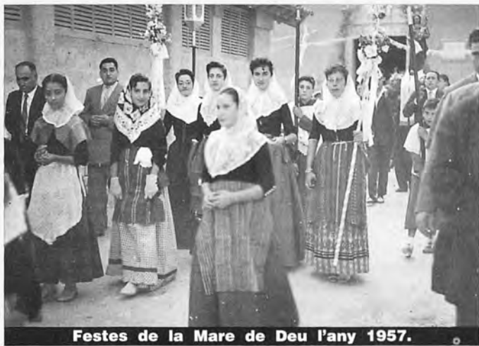
Festes de la Mare de Deu l'any 1957.