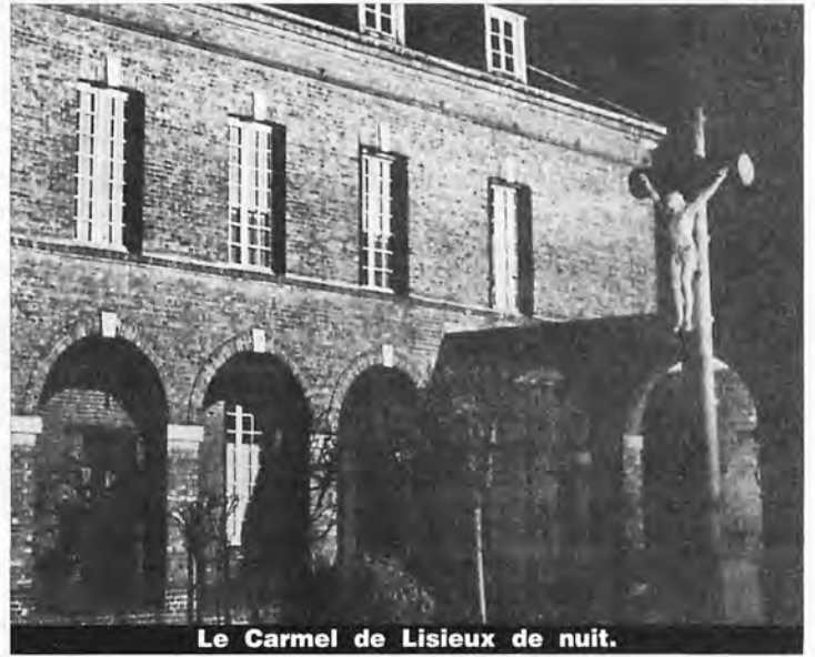
Le Carmel de Lisieux de nuit.

—Oui, ma pauvre petite, c'est l'agonie, mais le bon Dieu veut peut-être la prolonger de quelques heures.