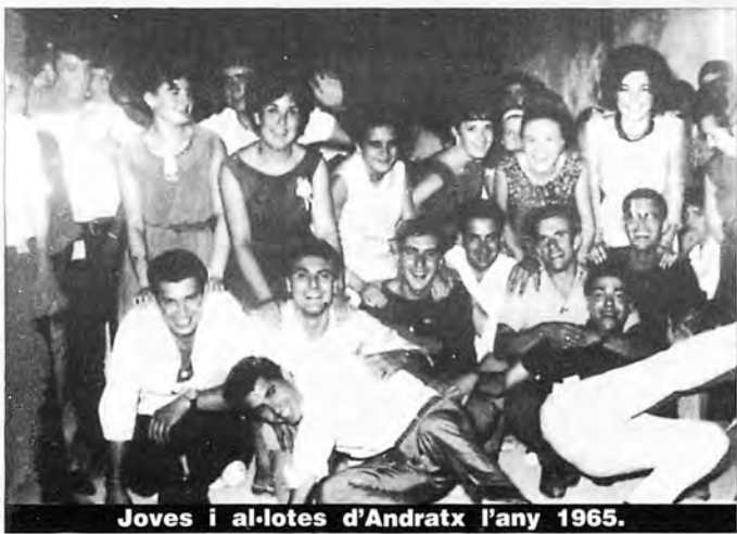
Joves i al·lotes d'Andratx l'any 1965.