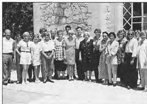
Varias Presidentas con las Autoridades.