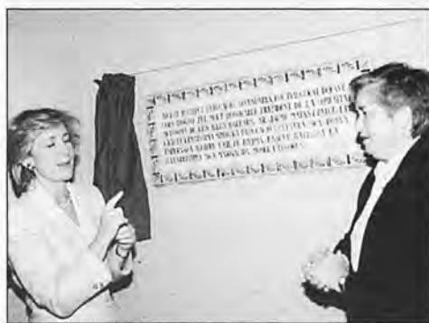
La Ministra de Cultura y la Alcaldesa de Andratx

• Fue inaugurado oficialmente el Instituto de Enseñanza Secundaria, que llevará el