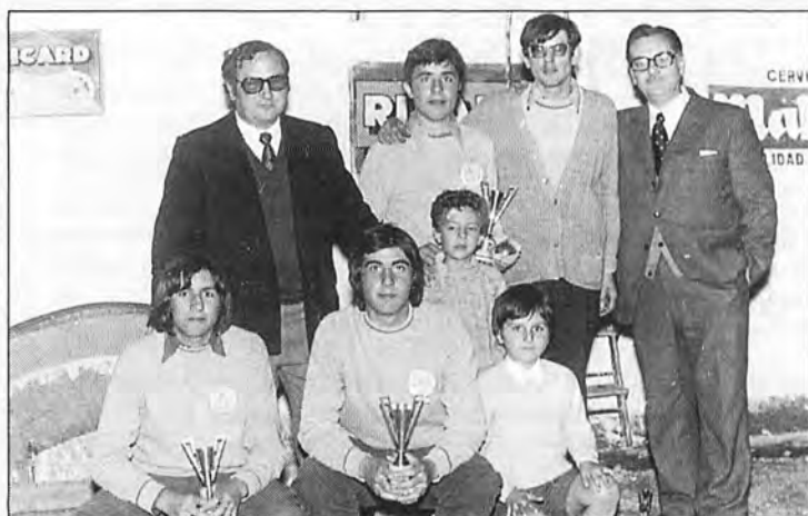
Raconers guanyadors d'un campionat de petanca de l'any 1973.