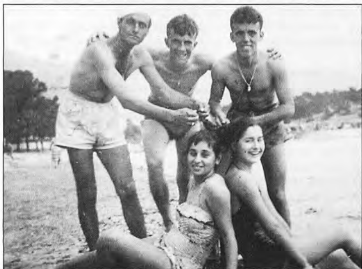
El jovent de 1960 a la platja de Camp de Mar.