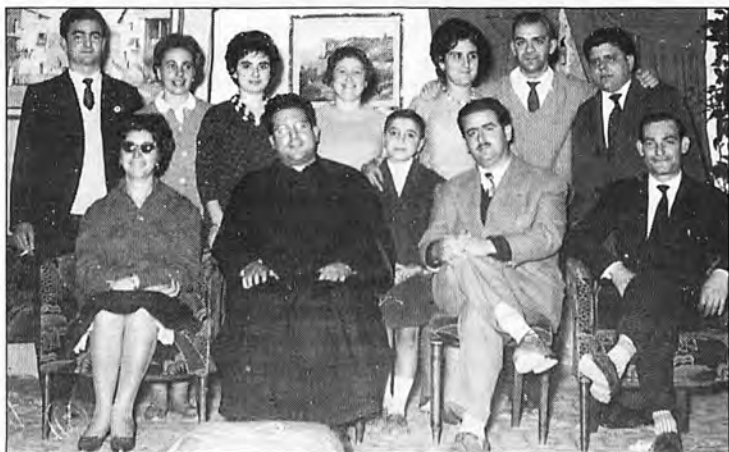
El grup de teatre "Agara" l'any 1961 a l'estrena de l'obra que més ha representat en la seva història "Jo sere el seu gendre".