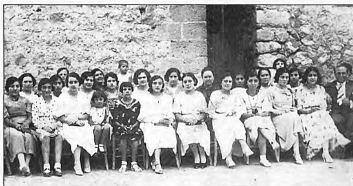
Les jovenetes de s'Arracó en les festes de Sant Agustí l'any 1933.