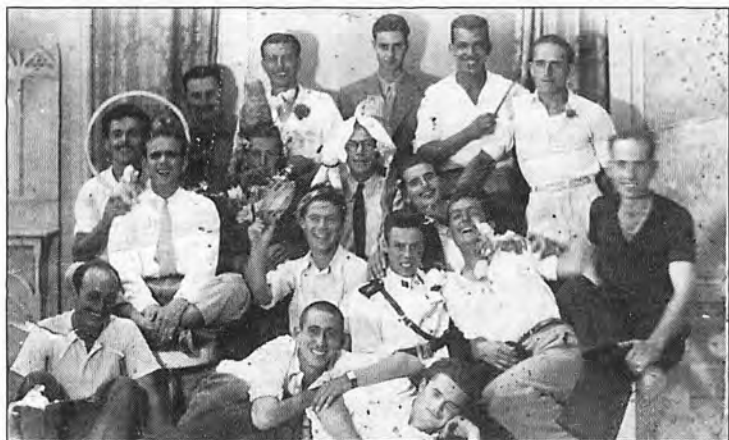
Un grup de joves d'Andratx després d'una festa l'any 1942.