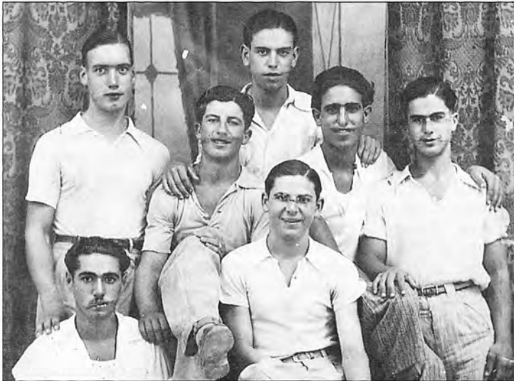
Un grup d'amics d'Andratx l'any 1938.