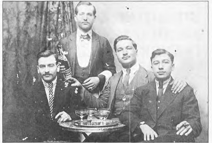
Reconers a França l'any 1924.