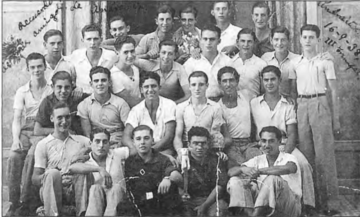
Els andritxols cridats a files l'any 1938.