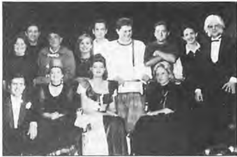
1996 el primer premio al Millor muntatge i direcció del VIII Certamen de Consell y Teatre Principal .