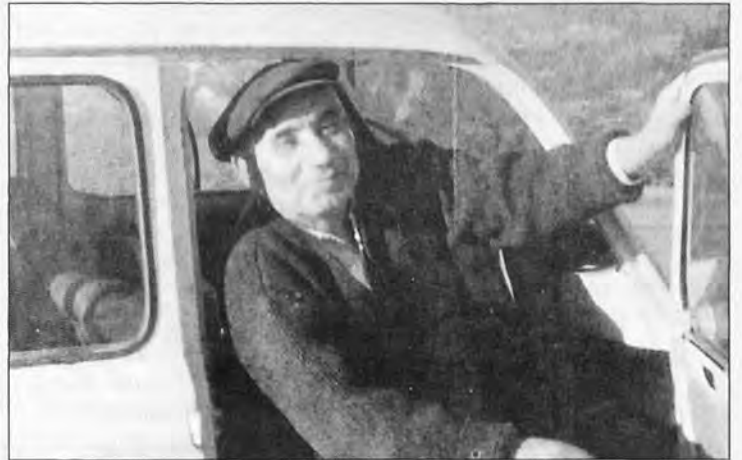
Un record a un reconer popular com va esser en Guiem Nou l'any 1967.