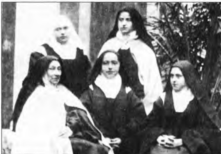
Auprès de la Mère Marie de Gonzague, les quatre sœurs Martin: Céline et Pauline en haut, Marie et Thérèse en bas. Photo prise en 1894.

Ez. 36, 24-28 “Je verserai sur vous une eau pure et vous serez purifiés”.