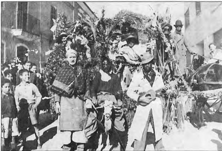
Les festes de Sant Antoni d'Andratx l'any 1949.