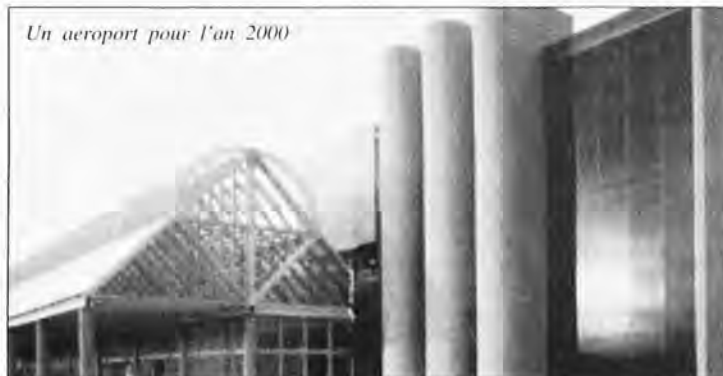
Un aéroport pour l'an 2000

Quand vous avez vos bagages, la difficulté suivante est de trouver la sortie de l'aérogare, à travers des salles immenses et mal éclairées la nuit, qui font penser à une espèce de tunnel sombre. Faute de panneaux indicateurs, vous pensez, à plusieurs reprises, vous être perdu en chemin. N'essayez pas de vous renseigner: les employés sont pratiquement inexistant dans cette zone, et ils n'en savent pas plus que vous! Tout change tous les jours! Pire encore, les employés n'ont reçu aucune information sur les mesures de sécurité en cas de coup dur; et les sorties de secours sont fermées avec des cadenas.