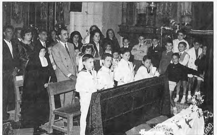
La primera Comunió d'un grup d'al-lots de s'Arracó l'any 1962.