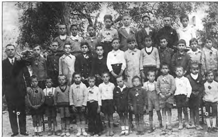
Los alumnos del Colegio de S'Arracó en 1930.