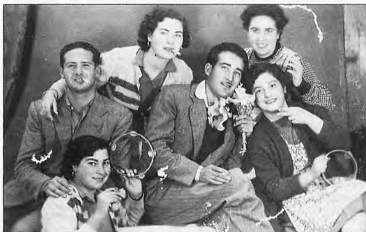
La juventud de s'Arracó en 1950.