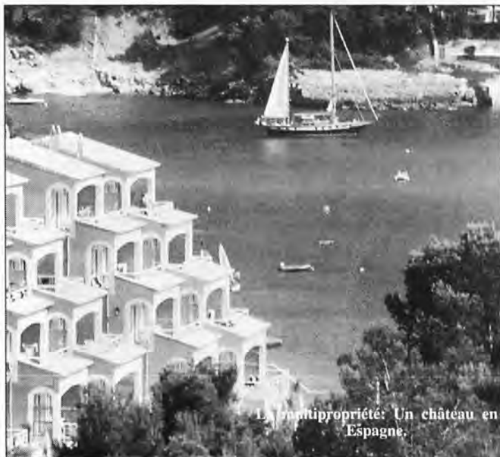
La multipropriété: Un château en Espagne.