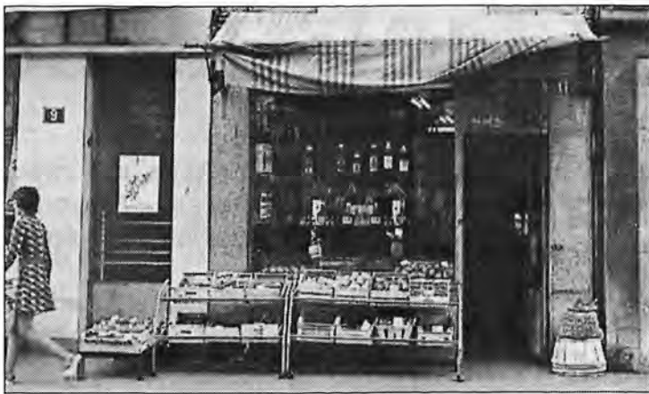
"Aux produits d'Espagne" chez Enseñat, rue du 170° R.I.