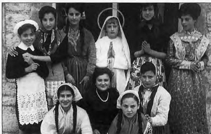
Una obra de teatro de las jóvenes de s'Arracó en 1964.