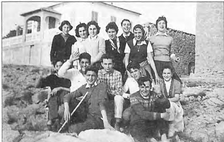
Grupo Adelita (1.959).

Unos grupos de jóvenes de Andratx de excursión: