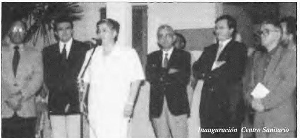
Inauguración Centro Sanitario

• Fue inaugurado por el Presidente de la Comunidad Autónoma Jaume Matas y Autoridades Andritxolas, el nuevo Centro Sanitario de nuestro Puerto, que consta de una sala de admisión, una enfermería y un