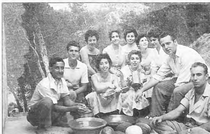
Grupo Adelita (1.960).