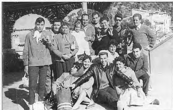
Excursión a Lluc a pie (1.960).