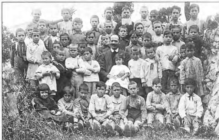
Los alumnos del colegio de s'Arracó en 1.925.