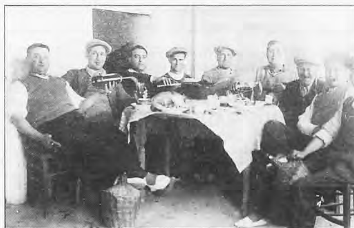
Los jóvenes de s'Arracó en 1.943 celebrando una comilona en Sant Elm.