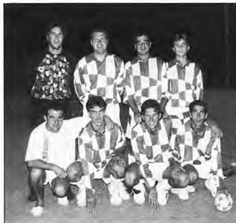
Equipo de fútbol sala M. Alemany

• Finalizó el XII Torneo de Fútbol-Sala «Villa de Andratx» en el que participaron 15 equipos: L'herbeta, H. Flor de Almendros, Montesión, Cruz Roja, Construcciones Miguel Alemany, Dream Team, Kadadivendres, R. La Pampa, Barlovento, Fusteria Jaume Covas, Bar J.J., Viajes Rumbo, Cafetería Tony's, Pata Negra y Old Blacks.