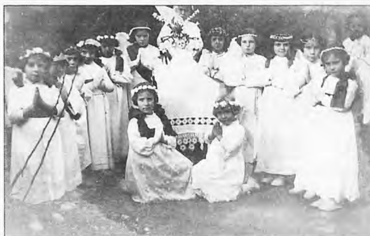
Las niñas de s'Arracó en una fiesta religiosa en 1.930.