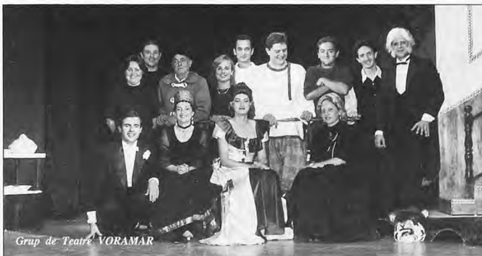
Grup de Teatre VORAMAR

Las Fiestas Patronales del presente año se