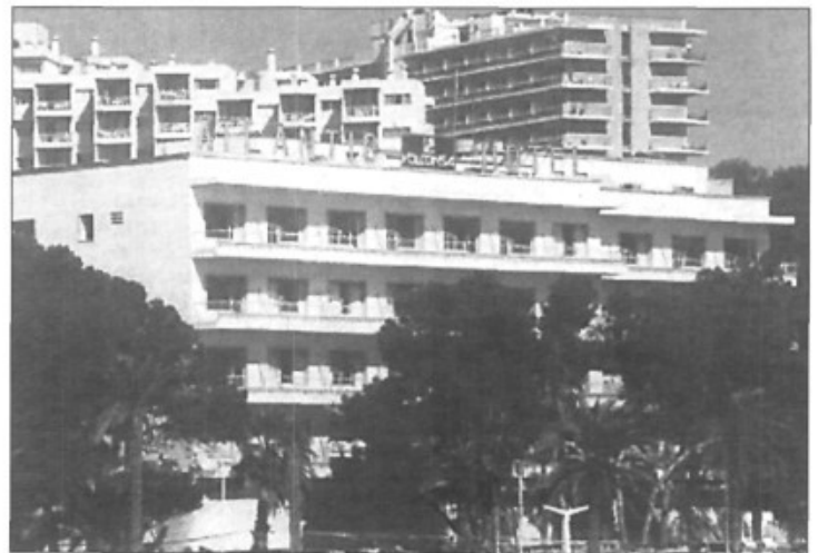
El hotel Atlantic fue construido en 1959 y tenía una capacidad para 150 plazas.

La plage militaire d'Illetas va enfin être ouverte au public l'été prochain. Une vieille aspiration des «palmesanos»!