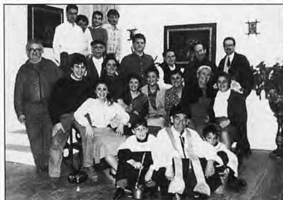
4.ª Epoca 1979 - 1995