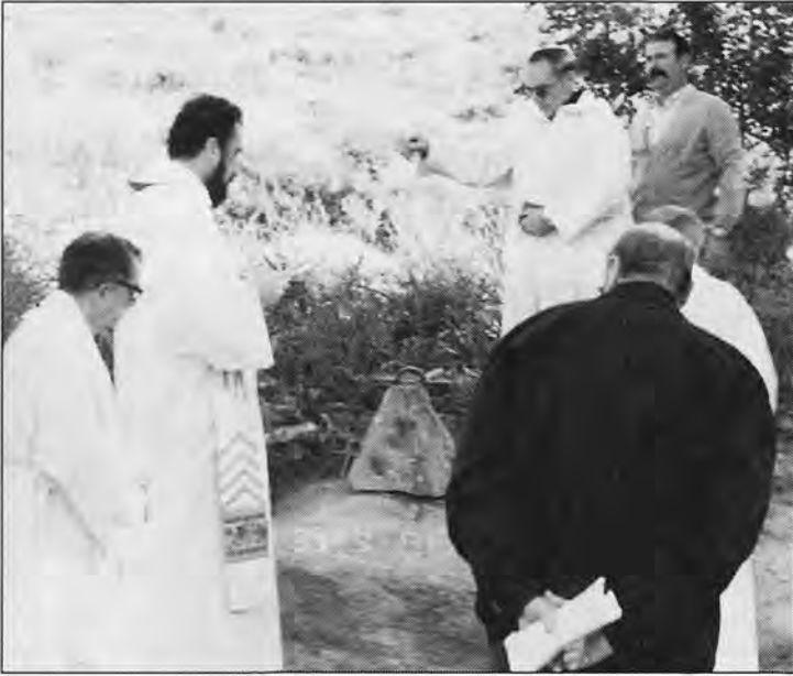
Bendició de la 1. a pedra de l'Església de Sta. Catalina Thomàs a Sant Elm el 31 de març de 1986.

fums de les seves virtuts i brillen les pregàries de la Santa Mallorquina Sta. Catarina Thomàs, a qui en humil ofrena hem dedicat agraït homenatge de l'Església, falta a Sant ELM, com a fletxa que apunta a les altures: la tasca dels humans: peus en terra amb el treball: mirades amb pregàries cap al cel.