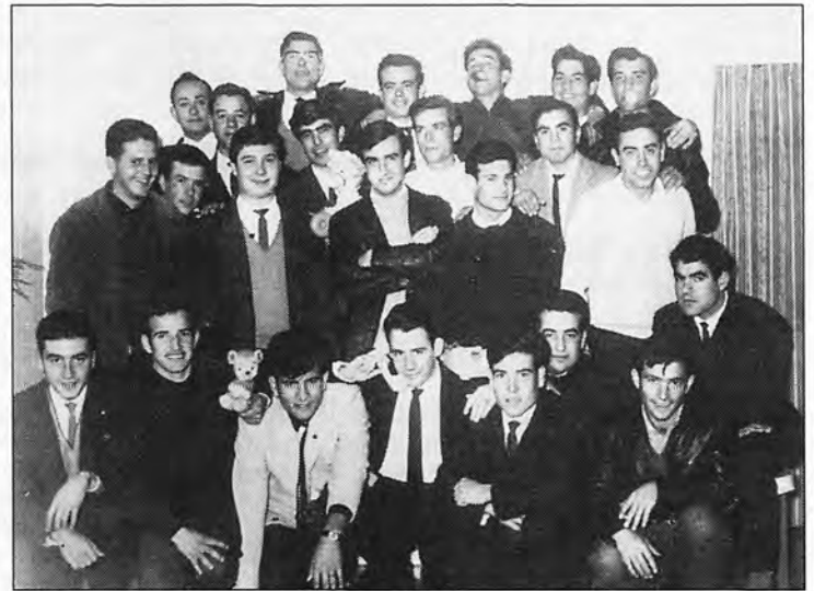
Quintos del año 1965.