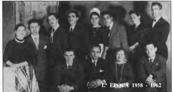
1.ª EPOCA 1958 - 1962