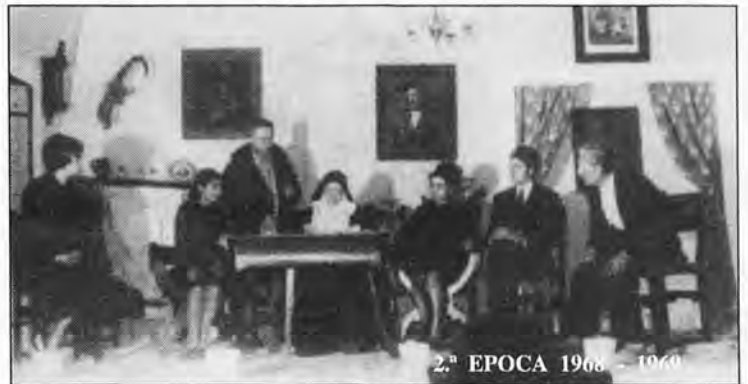
2.ª EPOCA 1968 - 1969