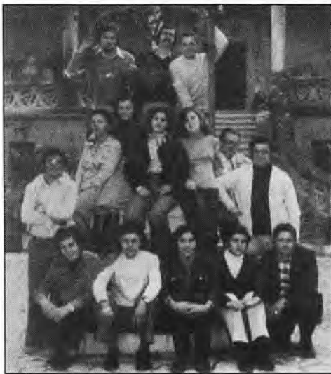
3.ª Epoca 1975 - 1978