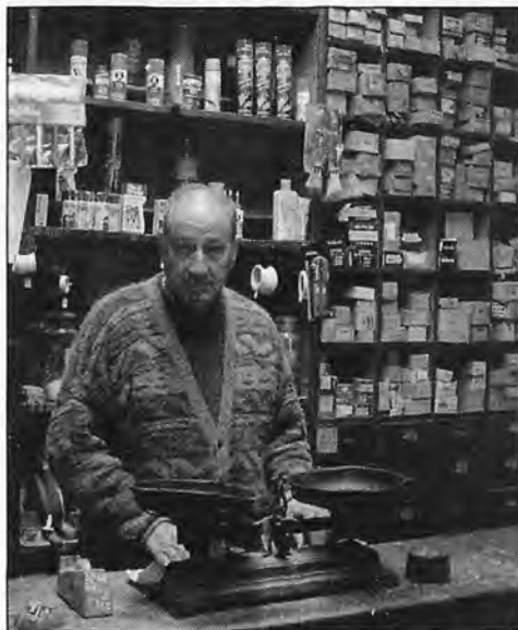
El comercio tradicional está condenado si no es capaz de renovarse o buscar alternativas.

regidos, normalmente, por cadenas de negocios multinacionales. La profusión de disponer de vehículo propio para los traslados y transporte del género contribuye a que no sea un obstáculo el desplazarse desde el domicilio para efectuar la compra semanal a cierta distancia.