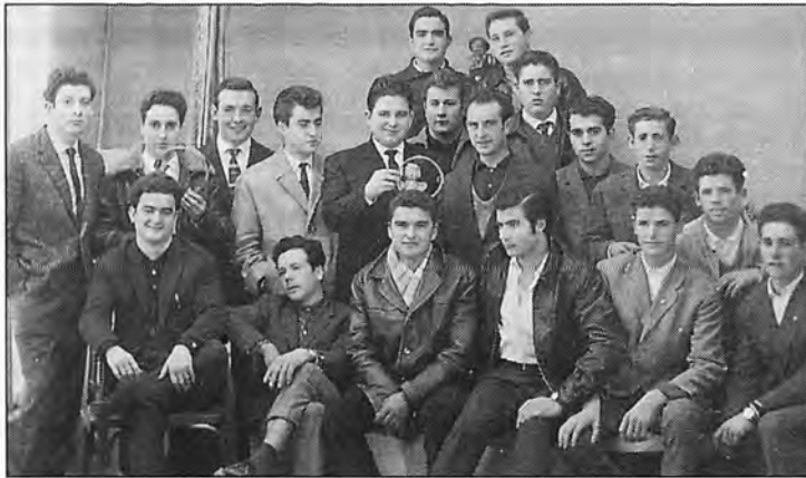
Quintos del año 1963.