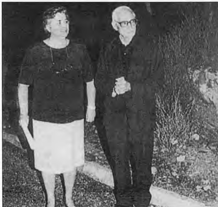
La alcaldesa junto al párroco de la localidad.

"Fill d'aquesta terra de soca-rel i prevere per gràcia del cel: em congratulo moltíssim amb vosaltres en nostre Senyor Jesucrist, amb congratulació mútua sentida amb la vostra presència: Entitats de restauració, Associació de veïns amb son president al cap, Col·lectius culturals i esportius, Organit-