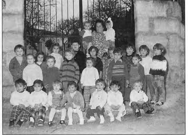
La actual juventud de s'Arracó, en 1973 y 1975, en la guardería de dicho pueblo.