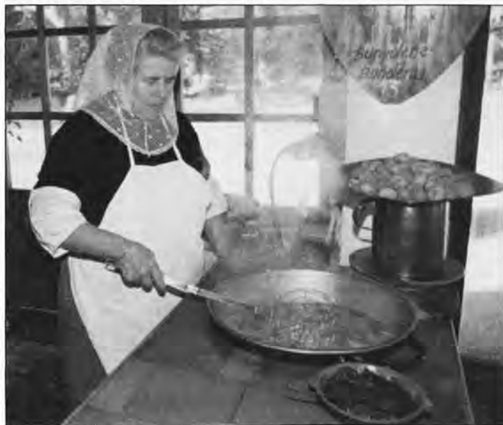
Una mujer prepara "bunyols" en la Granja.

Les pâtisseries, de leur côté, vendent des profiteroles, à la crème ou au chocolat, en accord avec les goûts de notre époque; mais au détriment de la tradition.