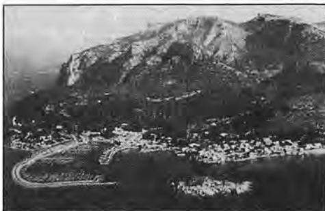
Así se verá Sant Elm con su puerto deportivo.

• Los concejales del equipo de Gobierno, con el apoyo de los ediles de A.L.A., no