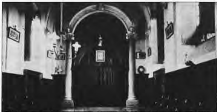
Le chœur du Carmel presque tel qu'il était du temps de Thérèse