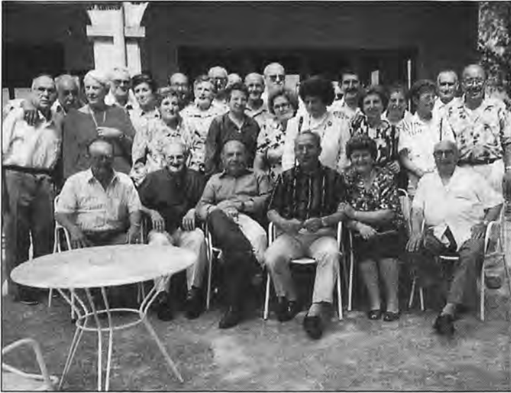
Una bella estampa bien lograda por nuestro fotógrafo don Juan Porcel Seuvà, estampa que lleva camino de ser centenaria, captada desde hace años en el restaurante de "Es Coll d'es Pi", término de Estellencs.

provenientes de los cupones de las Cartillas de Racionamiento impactaban de lleno en la diana de cada uno de los españoles hambrientos y por supuesto las criaturas o niños. En el año 1941-42 ya nos encontrábamos expandidos por diferentes destinos militares en el ámbito de nuestro país. En el año 1941 como digo, yo militaba en el Cuartel de Brigadas de Instrucción en el Ferrol del Caudillo, allí fuí testigo presencial día tras día contemplando la monda de un saco de patatas de 60 kg. para "saciar" a 12 Compañeros.