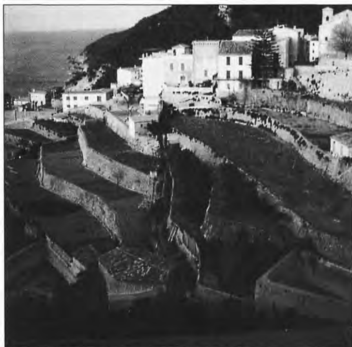
Banyalbufar, sobre los bancales