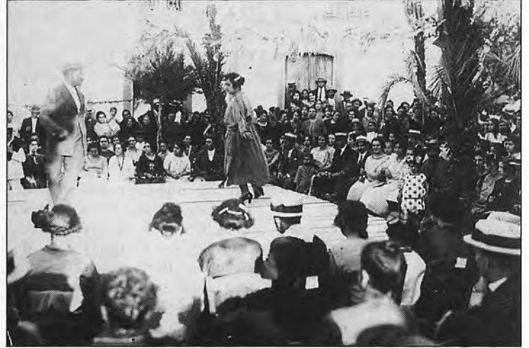
Dos instantáneas de las Fiestas de San Agustín de s'Arracó en 1923 con los mozos y mozas de aquella época.