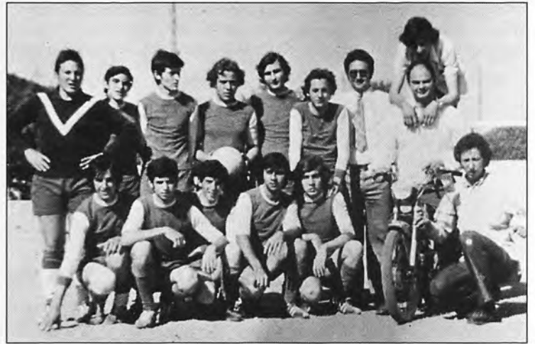
El equipo de fútbol del Bar Salon Recreo de Andratx en 1970.