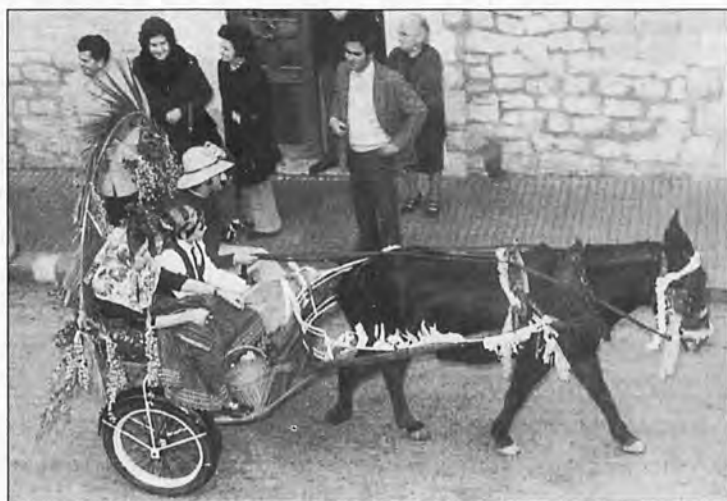
Otra instantánea de 1973.