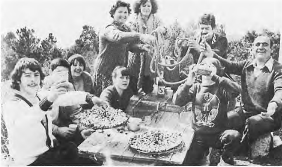
Une atmosphère de fête un tantinet mystique.

ne, ni avec les "petits gris" de Paris, farcis de beurre, ni avec les "cagouilles" charentaises cuisinées à la tomate.