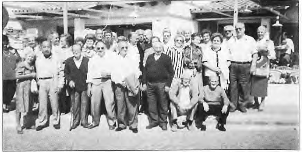
Pensionistas agrupados en la terraza del restaurante "Ardesia", en San Telmo, olvidándose de la reducción de sus pensiones ¿Será una falacia, engaño o mentira institucional? ¿Queerán repartírsela entre unos cuantos amiguetes?

Yo difiero y discrepo de las desafortunadas e incongruentes puntualizaciones