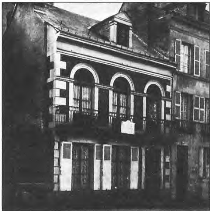
ALENÇON: LA MAISON NATALE DE THERESE MARTIN, AVANT L'ERECTION DE LA CHAPELLE.