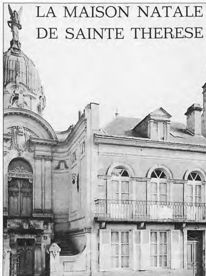
LA MAISON NATALE DE SAINTE THERESE