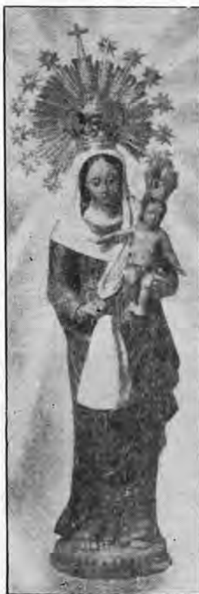
Nuestra Señora de la Trapa