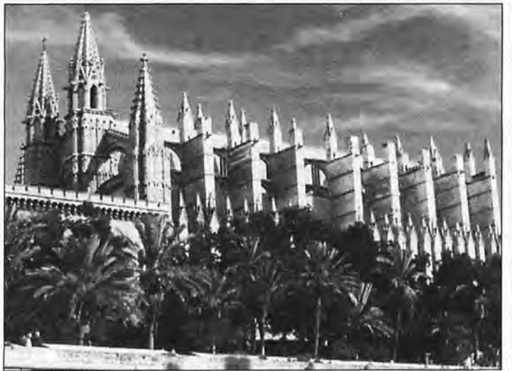
(Suite page suivante)

Notre évêque actuel disait en 1974: «Je veux faire mention d'une autre colonisation, celle des coutumes et du mode de vie.