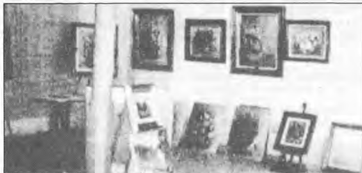
Estudio-Taller de Pedro Alemany