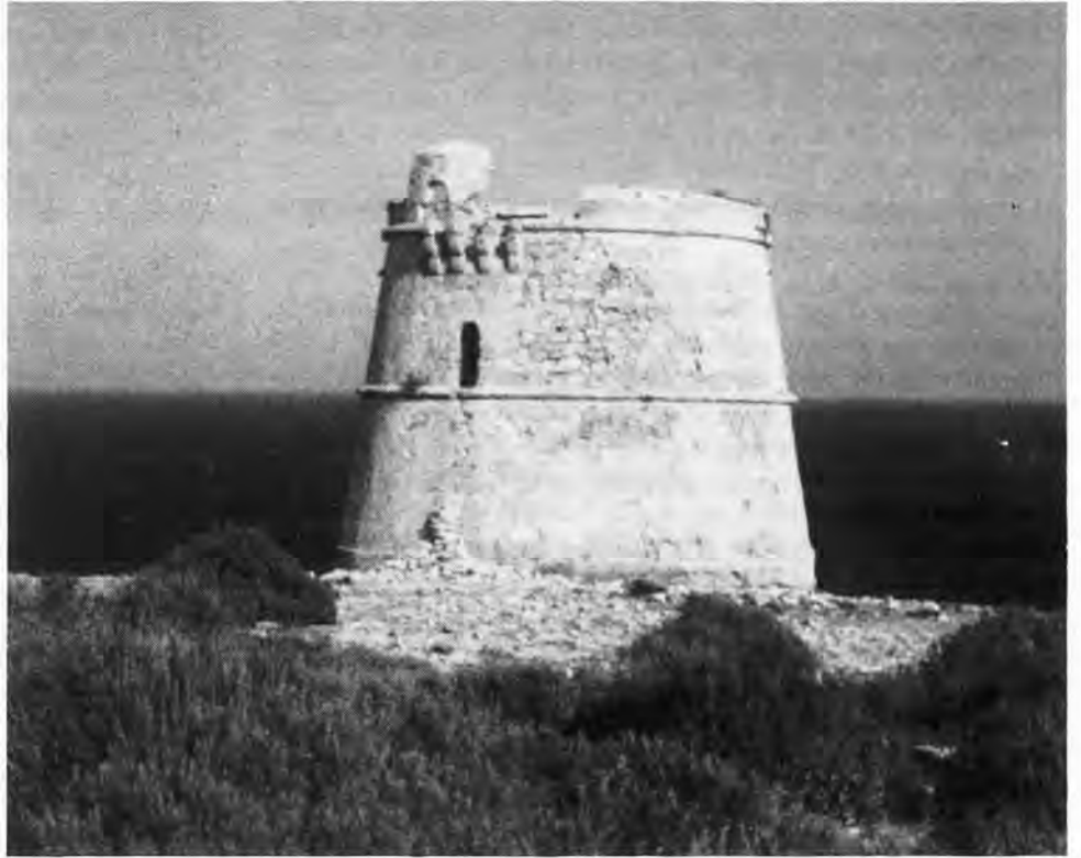
Torre del Cap de Berberia.

A la fin des années cinquante, l'amélioration du niveau de vie des européens donne naissance à ces grandes migrations de touristes vers le Sud de l'Europe, les plages, le soleil, et la sangria à bon marché! Grâce au tourisme, l'Europe du Sud sort de la misère. Hélas, le paysage paie les conséquences de l'avalanche touristique; et, le plus souvent, l'essentiel des bénéfices reste à l'étranger. Formentera, avec son clima agréable hiver comme été, ses grandes plages, ses eaux limpides, son paysage bien conservé, sa tranquillité, est une tentation pour les «fous du béton». Mais Formentera a tenu tête, et elle est restée presque vierge jusqu'à nos jours. Les formenterenses ont su monter leur petit commerce (hôtel - restaurant - magasin) pour vivre des visiteurs, mais sans se