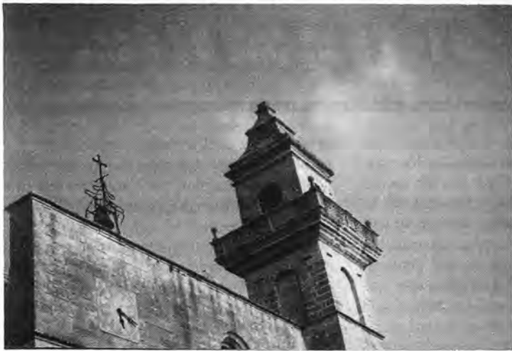
Espadaña, campanario, campana y reloj del frontispicio de la parroquia de Ntra. Sra. de Loreto, en Lloret de Vistalegre.