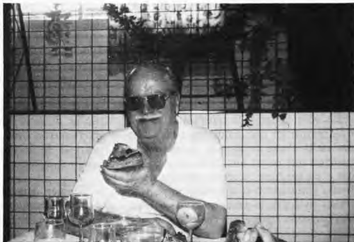
El abuelito deleitándose con un sabroso pastel de hojaldre de manzana, deliciosa mermelada, guindas y muy azucarado. Una golosina muy apreciada entre las exquisiteces de la pastelería y, que le está prohibida, el degustarla.

Gratitud a manos llenas para todos sin excepción. Enhorabuena.