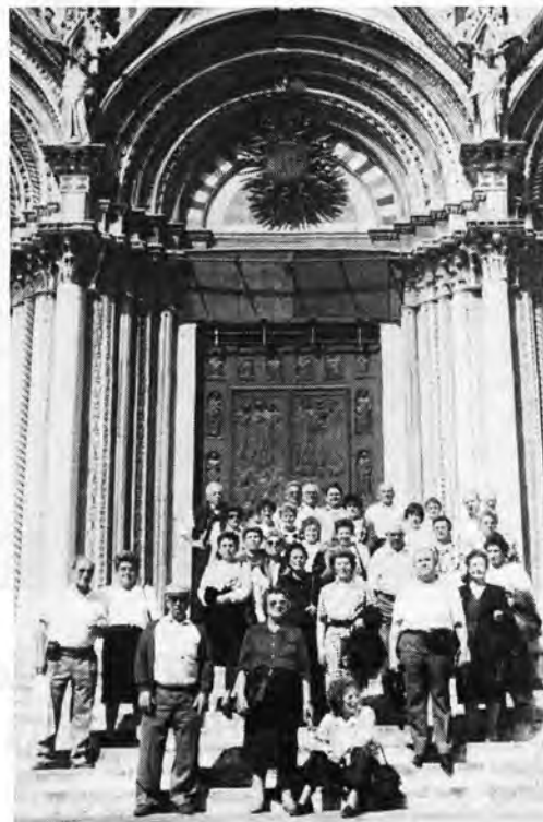
Vista parcial y escalinata de la puerta de entrada a la Catedral de Siena.