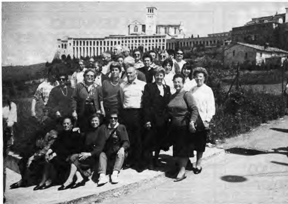
Un grupo de loretanos felices y contentos haciendo un alto en el camino. Al fondo una panorámica cuya, es alcanzar la meta propuesta. La iglesia de San Francisco en donde el Santo de Asís yace enterrado.

El grupo de loretanos enfocados en la penumbra de la sombra, no quieren perder resquicio posando frente las arcadas y campanario de una iglesia o casa conventual.