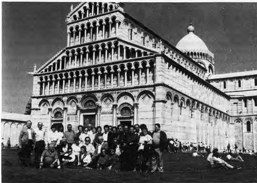
El grupo de loretanos ante la cámara fotográfica no quiere tener desperdicio. Le podemos admirar frente a los pórticos de entrada y al admirable frontispicio de la bella y monumental Catedral de Pisa.