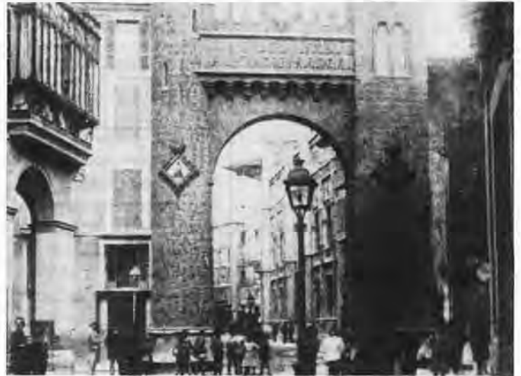
El arco de la Diputación, en Palau Reial.

L'eau courante est peu abondante et de mauvaise qualité. Un siècle plus tard, nous en sommes au même point! Et, comme aujourd'hui, ont fait la queue aux fontaines municipales, ac-