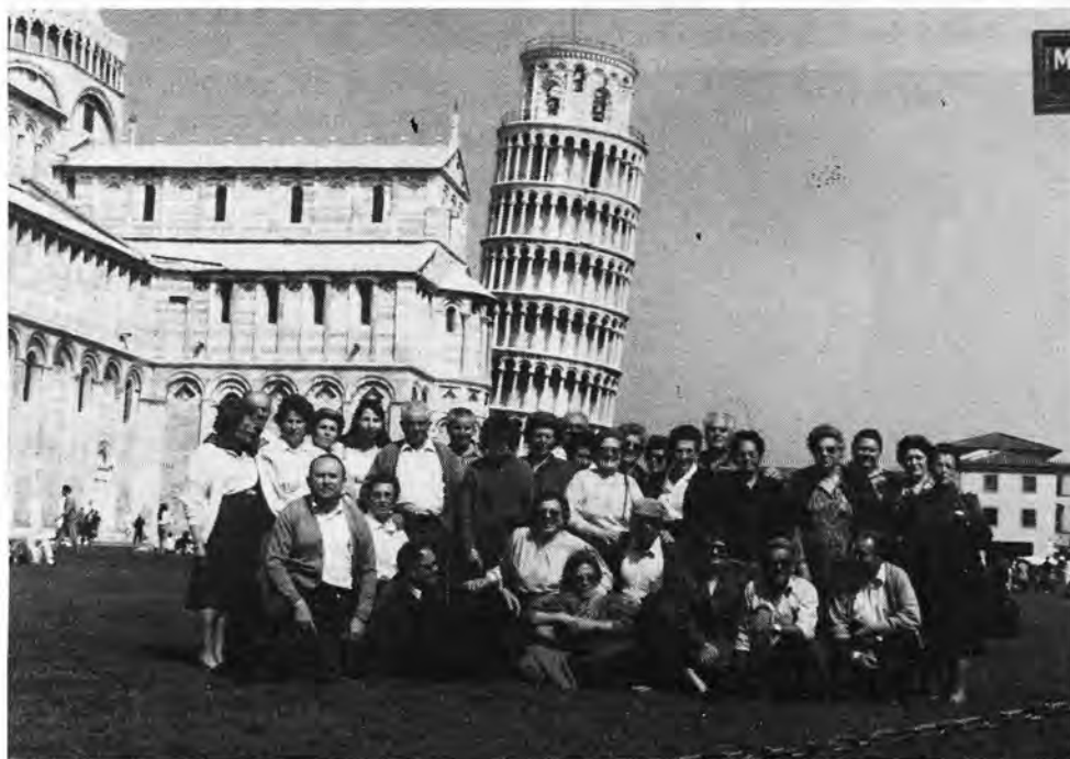
Una instantánea captando al simpático grupo de turistas loretanos bastante apartados del peligro que pudiera cernirse sobre sus cabezas. Un desnivel de la famosa y renombrada Torre de Pisa la cual está al parecer a punto de caerse.

Nuestra Sra. de los Angeles (La Porciúncula) con la capillita del Trancito (muerte) de San Francisco.