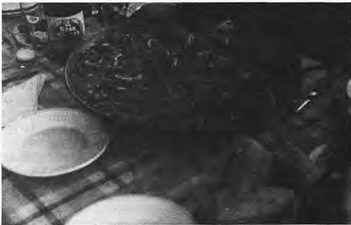
Una paella de arroz en la sombra. Una bien reputada especialidad en la que aflora en su superficie la langosta mallorquina, las cigalas, mejillones y bien guarnecida de calamares, carnes y verduras.