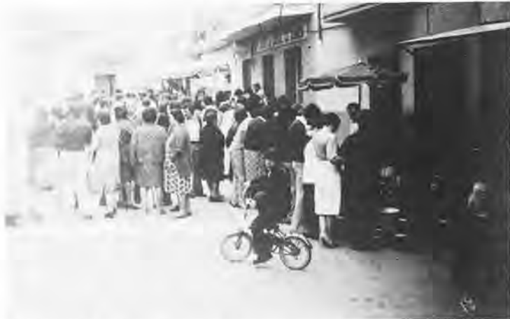
Una céntrica calle de Lloret de Vistalegre animadísima en un día de feria.