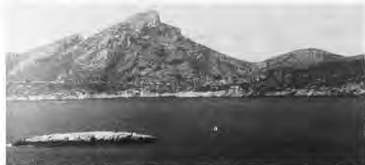
La historia le denomina el estrecho, sin embargo, se le llama «es freu i s'illa mitjana». Una bella perspectiva de la parte central de la Dragonera y en su cima las paredes que restan del Faro Vei.

El navegar entre aquellas azuladas aguas de San Telmo y enfrentarse a una paella de arroz a la valenciana, gambas en abundancia, pescadas en aquel litoral, fue el complemento de una diada feliz y que de verdad satisfizo a un centenar de visitantes y, que de bien seguro, habrá servido para promover la atención de un nuevo grupo y del que muy posiblemente querrá imitar a los encantadores loretanos y, que de esta diada turística, regresaron encantados.