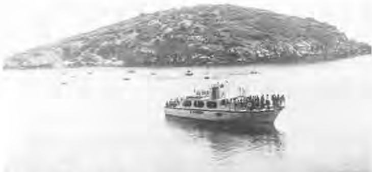
El histórico islote del Pantaleu con un mar encalmado. Una embarcación de buen tonelaje, cargada de turistas y maniobrando para acoderarse al espigón o embarcadero.

Y, es curioso repito, porque el agua está al mismo nivel del mar. En las horas de pleamar o bajamar el agua sigue perfectamente los movimientos del flujo y reflujo de la marea y, sin embargo el agua es dulce. El propietario de la Dragonera l'amo En Joan de S'Almudaina, durante su vida la canalizó mediante entubación a motor y dirigida al regadío de su huerto donde recogía preciosos tomates y abundantes hortalizas.