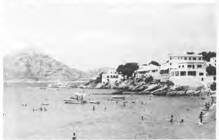
Vista parcial de la playa de San Telmo poco concurrida a primeras horas de sol por la mañana. Las primeras casitas de recreo que bordean la orilla. Al fondo la bella silueta de la Dragonera y el Faro Vei.