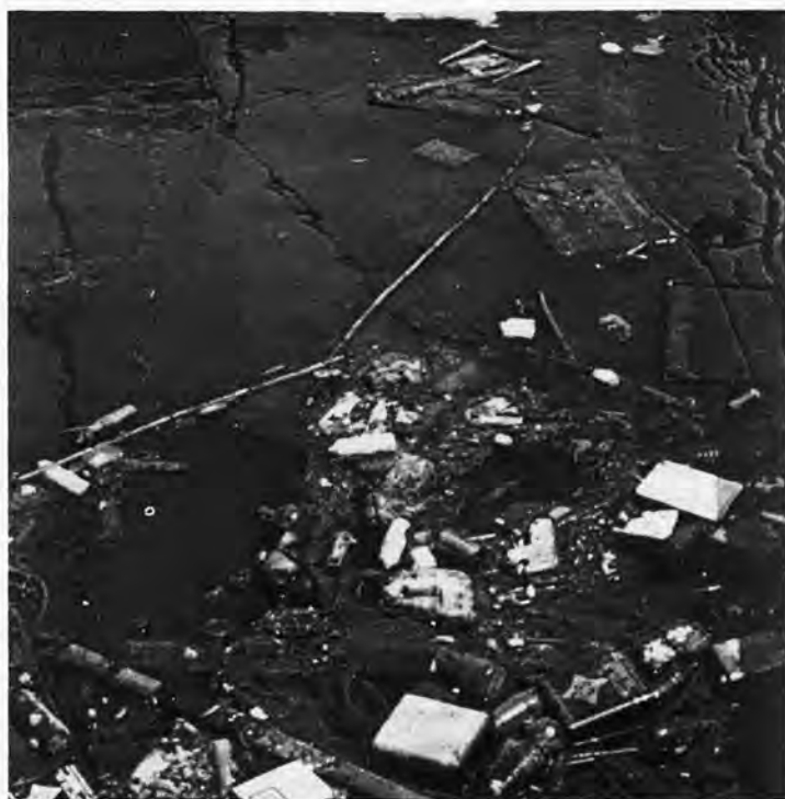
(Termina en la página siguiente)

Cada día se intensifican las voces de alarma que vaticinan la destrucción paulatina del ambiente natural de nuestro entorno. Los movimientos ecologistas emergen con fuerza tratando de alertar a la sociedad de los peligros que nos acechan si no se pone coto a los desmanes que alteran los principios vitales establecidos. A la naturaleza no se le burla impunemente. La tecnificación está pagando su tributo con catástrofes causadas o responsabilizadas por el hombre. Desde el dióxido de carbono de las combustiones hasta los excesos constructivos se intenta concienciar a la sociedad de los perniciosos efectos sobre personas y paisajes. Disminuyen las aguas químicamente potables en la naturaleza y proliferan las aguas subalveas contaminadas por tanto pesticida, vertederos de basuras y deshechos de la vida moderna. Hasta el mar Mediterráneo —casi un gran lago— se le augura la destrucción de su ecosistema por la progresiva contaminación de vertidos costeros. La lluvia ácida esquilmata los bellos bosques del centro de Europa. La inmensa cuenca del Amazonas —considerada como el mejor pulmón del mundo— es víctima de talas irresponsables de su arboleda y de incendios interesados que calvinizan sus frondosos bosques. En el polo norte se ha producido un creciente agujero en la capa de ozono atmosférico protector contra los rayos ultravioleta que pueden causar cáncer. Todo agravado por la acción indiscriminada de las sustancias químicas sintéticas que se utilizan como refrige-