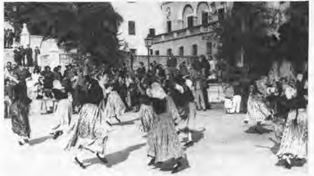
Danses populaires à Lloseta.

Les Baléares possèdent une richesse sans pareil en coutumes belles et ancestrales. Les verreries majorquines, les bijoux de Minorque, les sculptures en bois d'olivier, les objets en raphia et jonc, le fer forgé, les tissus «de llengos», les broderies, etc., sont célèbres dans le monde entier. Ces échantillons de l'artisanat balear présentent la beauté de l'ancien avec celle d'une confection soignée.