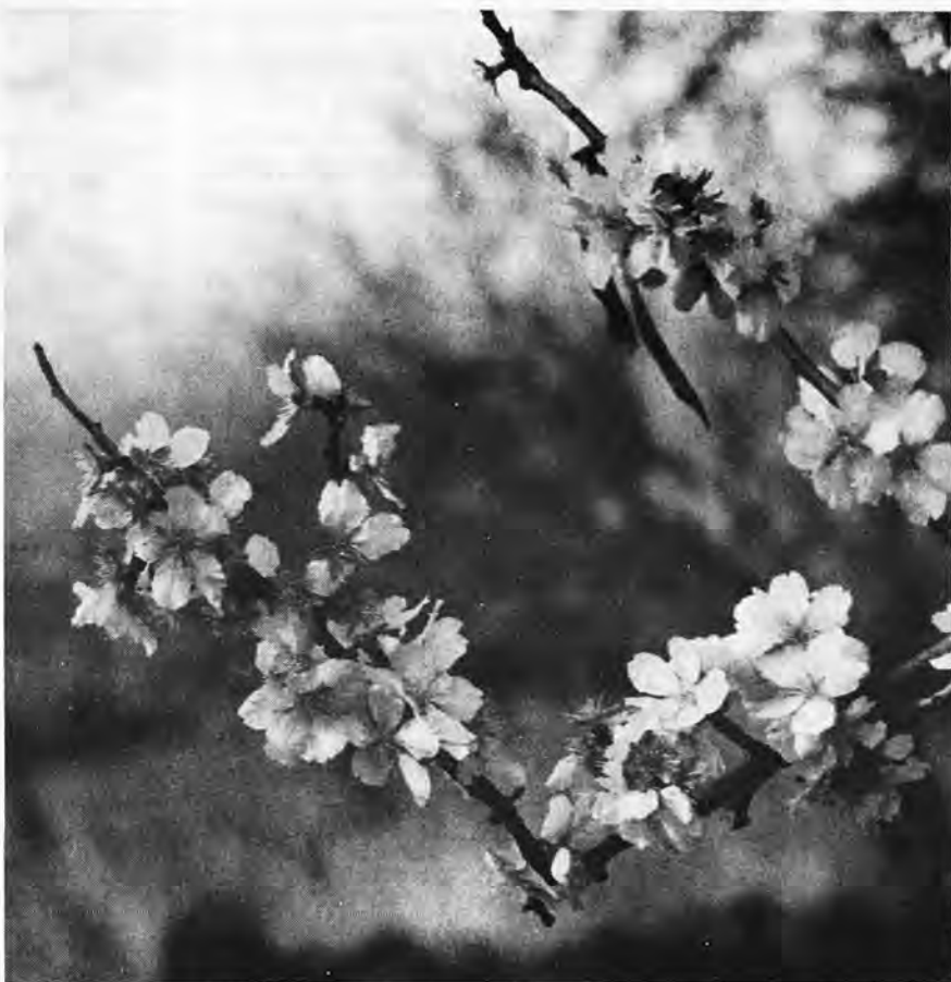
Les amendiers fleurissent en plein coeur de l'hiver.

Pendant la première moitié du XX. e siècle, l'amendier était la principale richesse de l'île, et la principale source de devises. Actuellement, l'agriculture étant presque totalement abandonnée au profit du tourisme; l'amende n'est plus rentable, et on la laisse souvent pourrir sur l'arbre.