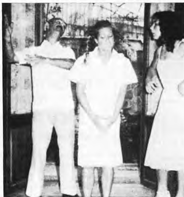
Tres integrantes de la Compañía AGARA durante un momento de su actuación en una de las divertidas representaciones efectuadas durante sus treinta años en diferentes lugares de la isla.