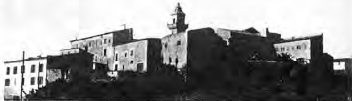
Vista de un grupo de edificaciones en el entorno de la iglesia parroquial con su campanario en lo alto del promontorio cerca del cielo. Una reducida panorámica captada desde la llegada por la carretera de Sineu.