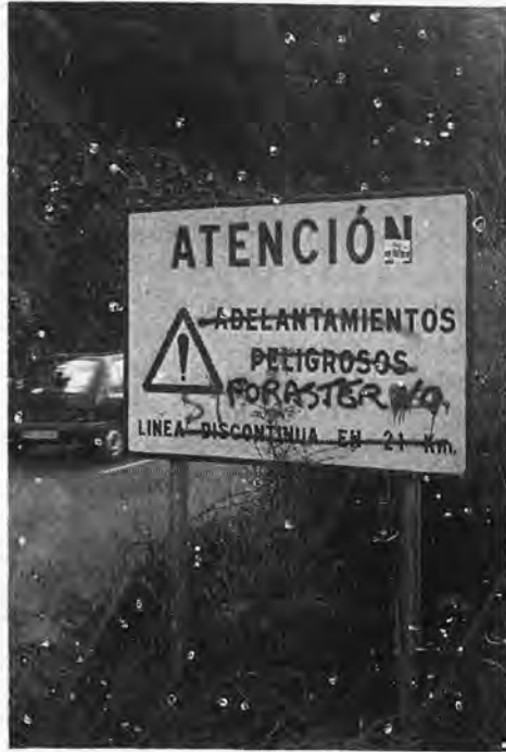
Les signaux, au bord des routes, souffrent, eux aussi, de la guerre des langues.

Les immigrants du continent se plaignent de ce qu'ils ont désigné comme le racisme des «polacos», étrange nom qu'ils ont donné aux majorquins. La barrière de la langue est très efficace. Majorquins et «forasters» se cotoient sans se mélanger. De plus, les enfants de langue castillane sont contraints d'apprendre le catalan à l'école, une langue dont ils ne voient pas l'utilité. Ils considèrent, comme leurs parents, qu'avec le même effort, ils pou-