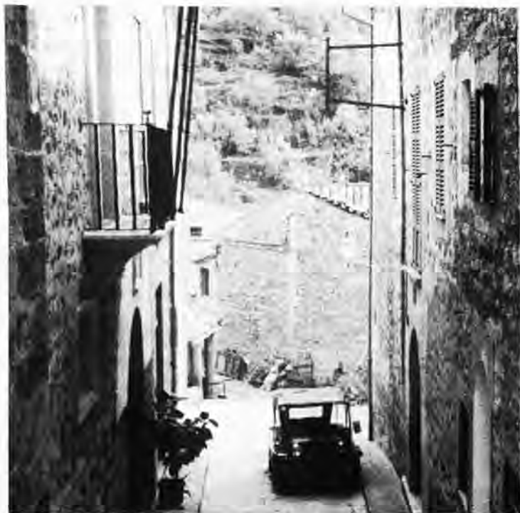
Façade et balcon de la Mairie de Fornalutx.

Jusqu'en 1812, le joli et charmant village de Fornalutx était un petit hameau de la commune de Sóller.