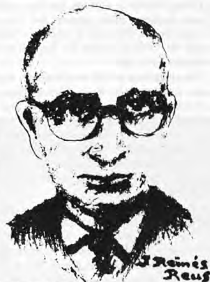
Dibujo de J. Reinés Reus.

Y esta actividad de historiador se ha mantenido firme a través de los años, pese a lo avanzado de su edad, lo que hace más meritoria su labor; labor, que pone de manifiesto que su jubilación lleva signo positivo, al contrario de otras