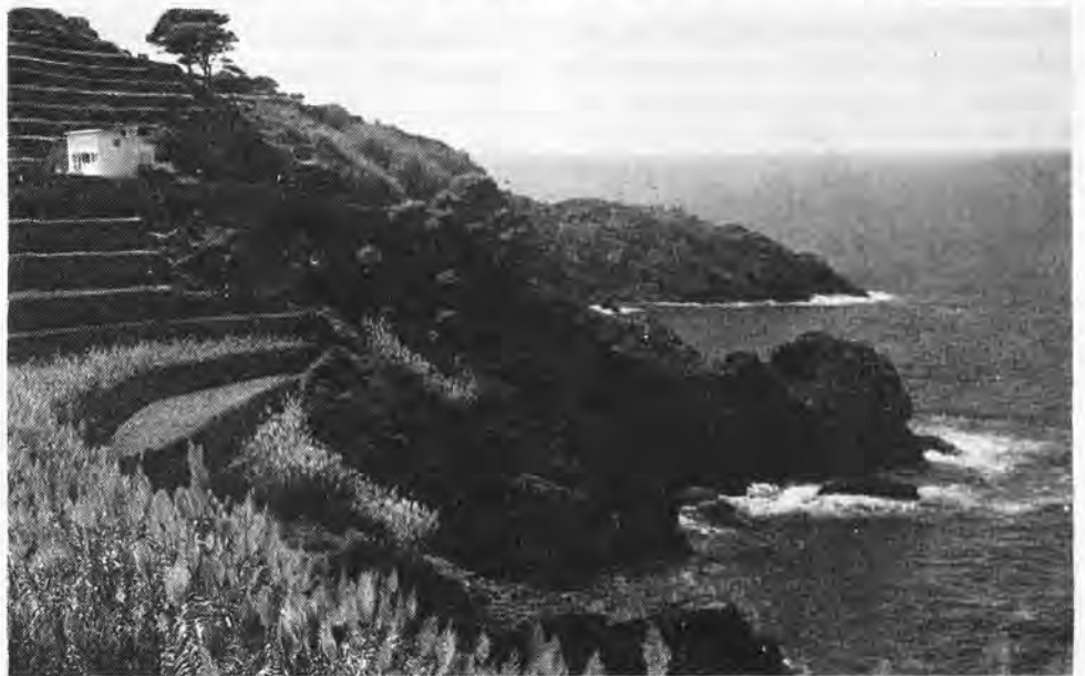
Costa de Banyalbufar. (Detalle).

Pues bien; en un lugar privilegiado, en pleno corazón de dicha sierra, dentro del término municipal de Valldemosa, en el predio Son Ferrandell y en la cercanía de Son Oleza, se proyecta, nada menos, que la construcción de un inmenso campo de golf de 628.350 metros cuadrados de superficie. y cuenta ya con el visto bueno municipal. Hay que pensar en la calva que se producirá en una zona de más de 80 cuarteradas. Allí es imposible ubicar un espacio tan amplio sin afectar a los olivos milenarios que aún subsisten. Y los olivos, de troncos tan singulares, son los que configuran las características peculiares de aquel paisaje. Sin ellos se perdería algo esencial. Lo incomprensible es que se permita arrancarlos sin mayores consecuencias. En Son Ferrandell y en la Granja de Esporlas —por mencionar algunos nombres— han desaparecido muchos en los mismos aledaños de la carretera.