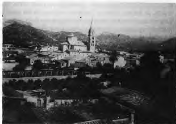
Vista general de Binisalem (Mallorca), en la cual sobresale el campanario de la iglesia parroquial.

Resulta incomprensible que con todo haya estado en una ceguera tan grande, pues él sabe muy bien que no existe ni ha