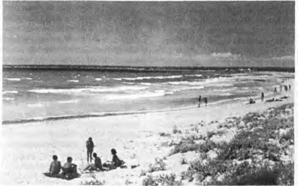
"La Plage de Es Trenc, encore vierge actuellement".

Vingt-cinq ans ont passé, et le développement incontrôlé de l'hôtellerie et des appartements touristiques a provoqué une concurrence acharnée qui a permis aux tours opérateurs étrangers d'obtenir des prix plus bas chaque saison au détriment de la qualité. En ce moment même, les voyages à Majorque pour une semaine, tout compris (avion,