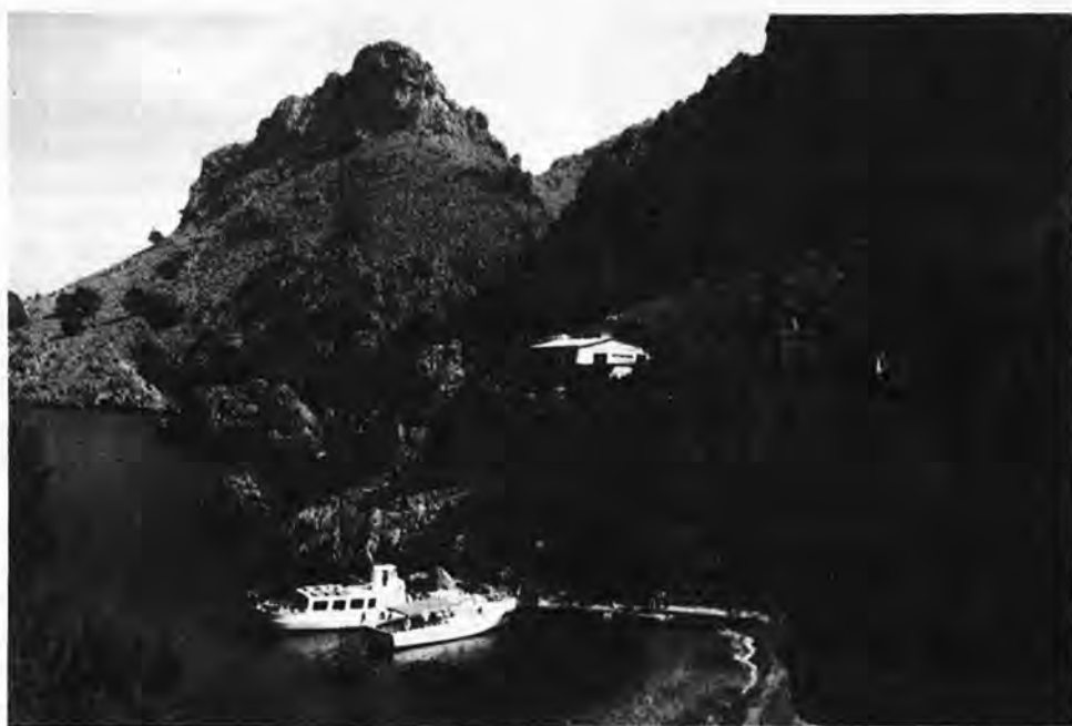
Nuestros paisajes serán siempre un gran aliciente para el turismo.

Pero las circunstancias de aquel acontecer son ya historia y no son las que concurren en estos umbrales del año 2000. Hoy, el mar, ejerce una atracción que aglutina los principales afanes de la vida isleña. Las clásicas explotaciones agrícolas de muchas zonas han perdido rentabilidad y se deslizan hacia la decadencia. En contraposición surgen pujantes urbanizaciones diseminadas a lo largo del litoral. El turismo, con su empuje placentero, también ha contribuido a ello. El Puerto de Andraitx, al