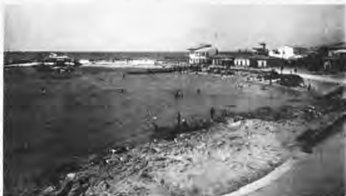
La Playa d'Or (Ca'n Pastilla).

Per unir les dues «poblacions» indicades, no hi havia encara l'actual carretera ni fins i tot un mal camí, ran de la mar. Amb tot i això, per salvar aquesta distància de cinc quilòmetres, teníem un trenet, d'un sol vagó, però un trenet! Així mateix, a voltes, si les circumstàncies ho demanaven, li enganxaven un remolc, per dur més gent. El nostre trenet duia un motor de gasolina, que us resplendia dins el cervell i feia tremolar tot el buc. Un dolç i suau tremolor, que us invadia les cames i el cos sencer, per fer més variat el trajecte. A la fi ho agràieu, perquè us llevava la son i així podíeu admirar el paisatge i les postes de sol meravelloses. Era un trenet domèstic, pacífic i sense pretensions, que amb greu dificultat mai sobrepassava els qua-