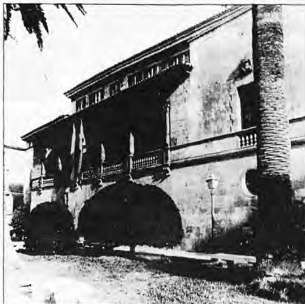
Consolat de Mar, seu de la Presidència del Govern Balear

perit que anima els actes oficials i la diada autonòmica que el Govern Balear prepara per a principis de març. Una commemoració que vol ressaltar i difondre tot allò que ens és propi i que marca les nostres vides. Una data perquè reflexionem sobre el fet balear.