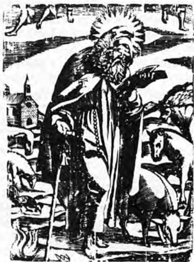
Sant Antoni, xilografia d'Antoni Moragues. (Col·lecció Guasp)

S'Arracó té Sant Antoni Diferent des demés Gran festa des raconés Totes queden a s'histori.