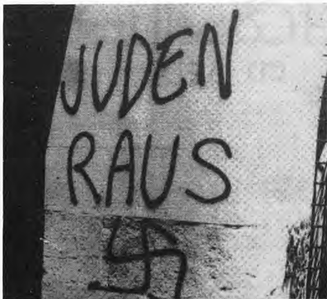
INSCRIPTION A PALMA

Et pour compléter le tableau, lors du premier novembre, le monument aux soldats italiens tombés durant la guerre civile espagnole, s'est vu désagréablement fleuri d'une