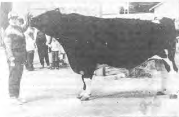
Voici une belle pièce qui fût admirée.

*La Foire Annuelle de Campos, s'est brillamment déroulée, grâce a sa bonne organisation. Le Conseiller de l'Agriculture et le President de la Communauté Autonome en firent l'inauguration.