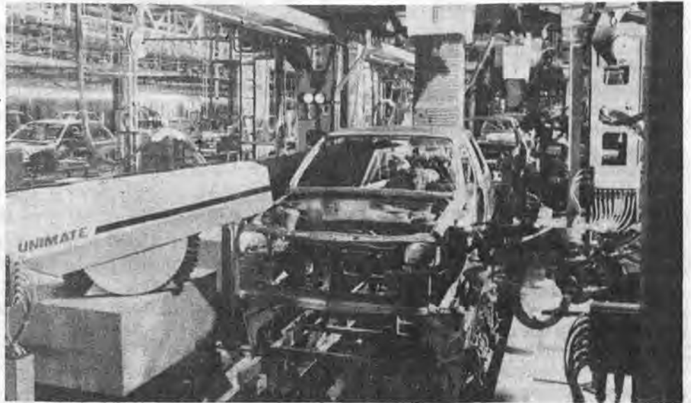
La robotization fabrique aussi des chômeurs.

Le gouvernement ergotte ce chiffre de trois millions, en faisant valoir qu'il est très «gonflé» par un nombre important de faux-chômeurs. C'est juste. Il y a plusieurs catégories de faux chômeurs. Tout d'abord ceux qui travaillent au noir tout en percevant les indemnités de chômage. Il y a même des entreprises qui ont officiellement fermé leurs portes (C'est la crise!) mais continuent leur activité dans un garage au fond d'une cour, ou dans un appartement. Pas de charges sociales, et pas d'impôts! Dans d'autres cas, les ouvriers font leur travail chez eux, en toute tranquillité, et aux heures que bon leur semble. Et, naturellement, personne ne peut empêcher un maçon, un plombier, ou un électricien, de faire des ré-