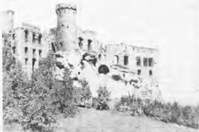
L'itinéraire des Aigles.