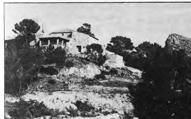
Sa Torre de Sant Telm