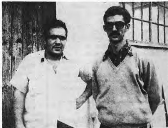
"Avons laissé un drapeau majorquin au sommet".

Le contre valeur de 150 millions de pesetas dorment dans les réserves, attendant l'acheteur, pour une marchandise qui est de toute première; et qui risque de se perdre. Quel dommage.