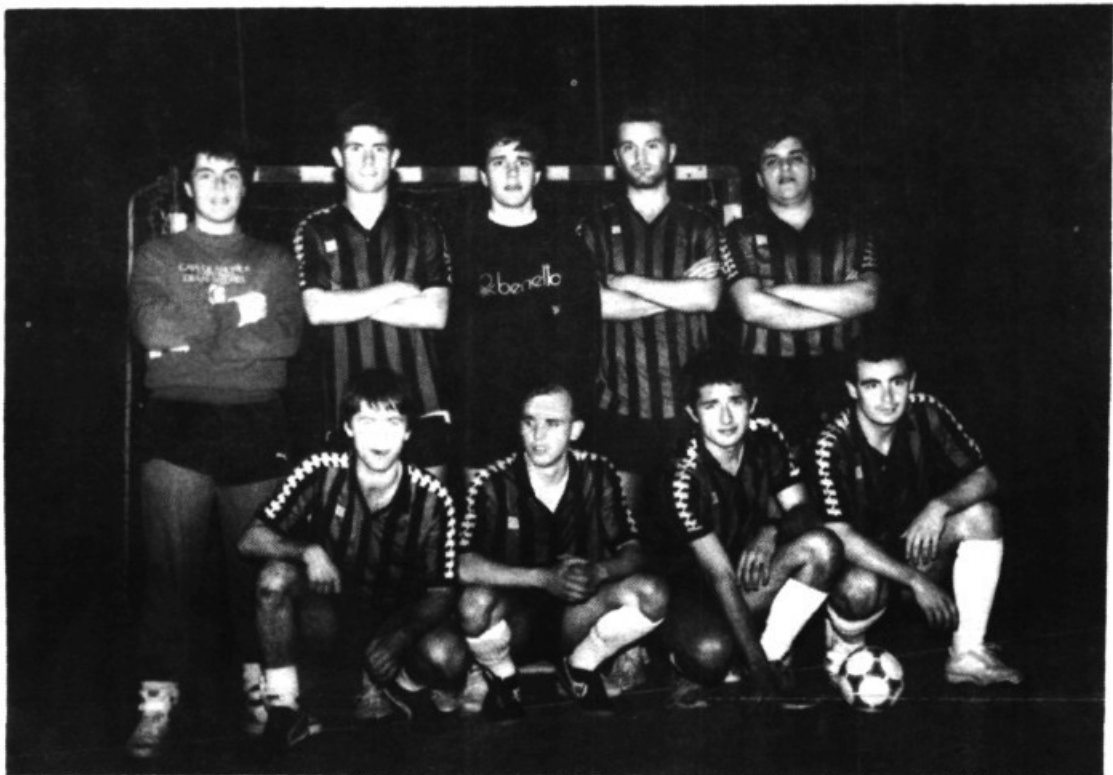
Inter-Nirvis, grup d'una gran activitat deportiva