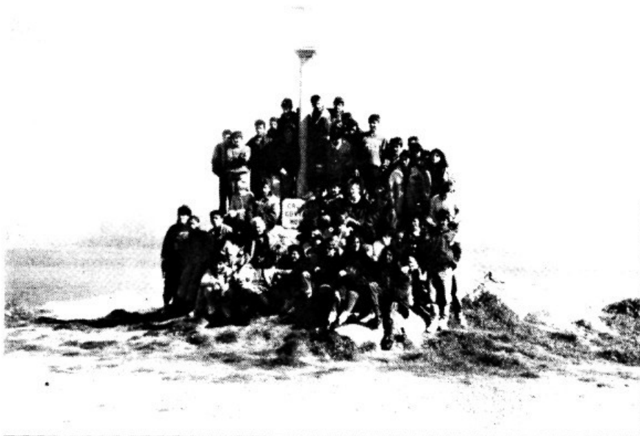
El grup d'8º d'E.G.B. d'excursió a Galícia

El dijous ens aixecàrem per a anar al Nord de Galícia, a la Corunya, per visitar: La plaça de Maria Pita i el Museu de la Ciència, on hi ha el planetari. Aquí ens varen explicar tot sobre els horòscops i les estrelles. Havíem d'anar a la torre d'Hércules però llavors per problemes de temps no hi poguérem anar.