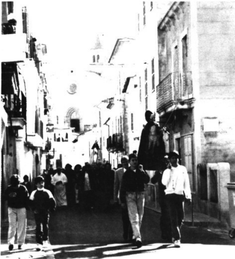
Pasqua: Processó de l'Encontre