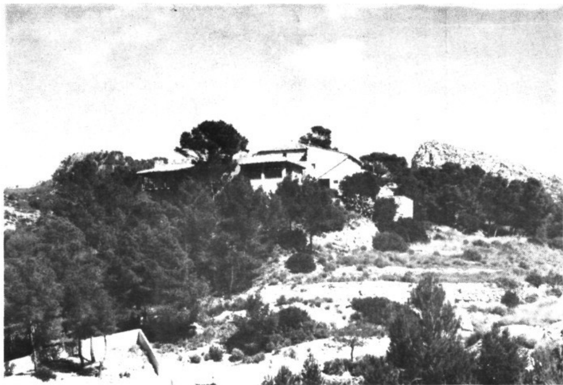
La Torre de Sant Elm, lloc del Pancaritat