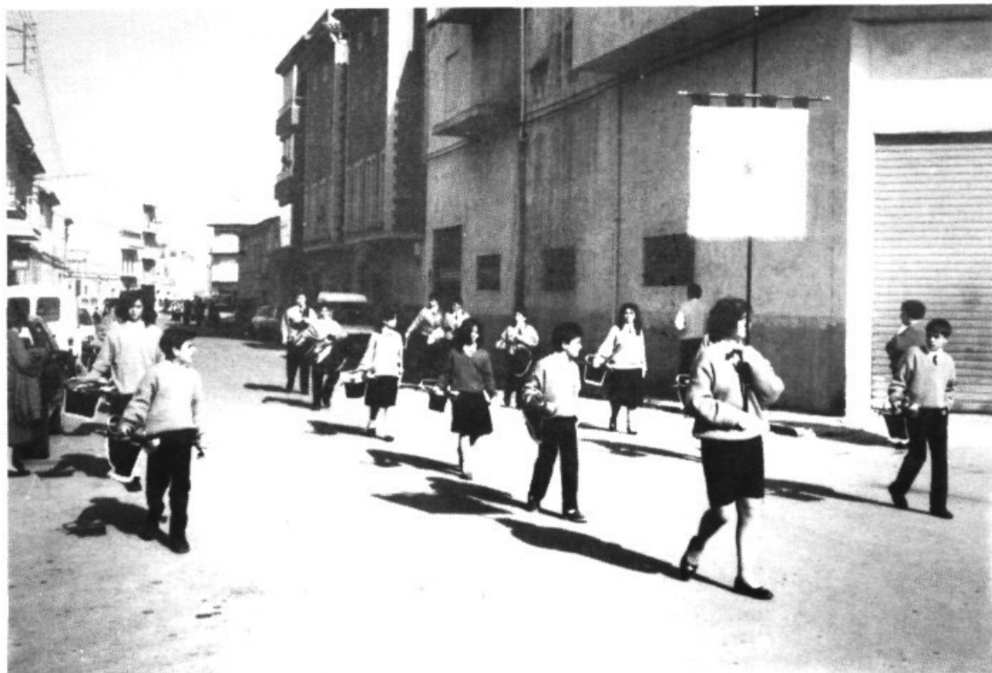
La Banda parroquial de cornetes i tambors d'Andratx anà a la I Trobada que tingué lloc a Manacor, dia 19 de febrer.