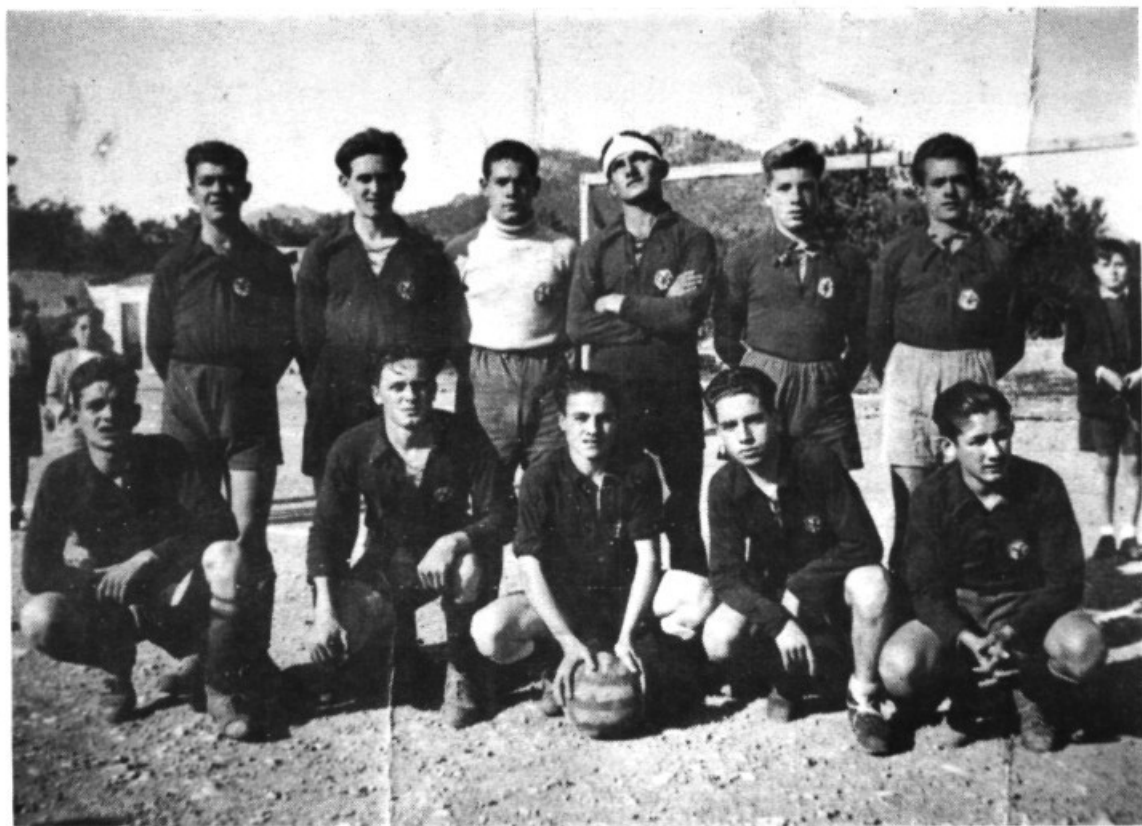
Equip dels "Congregants", 1954-55, abans de que el C.D. Andratx es federàs. Abaix, la Banda Municipal d'Andratx (1933)