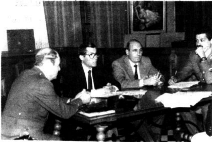
Acte de constitució de la Junta de Seguretat d'Andratx.