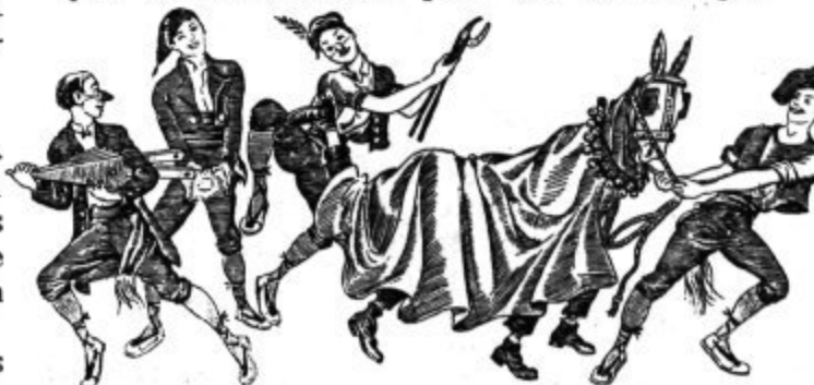
Joc de la mula gaita, de Santa Coloma de Queralt, a la baixa Segarra.

A Palafrugell feien la Mula Morta. Posaven un crani de mula o d'ase al cap d'un bastó. Entre les dents col·locaven un grapat d'herba ben bruta d'una substància mal olorosa amb la qual tocaven tanta gent com podien. La Mula feia jugar el bastó ençà i enllà per conveniència per tal d'enutjar