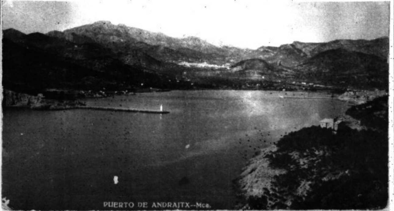
PUERTO DE ANDRAITX—Mca.

Dues fotos prou interessants ses que presentam avui, una d'elles pertany a la col·lecció de fotos que hi ha del nostre port, tan bell altre temps i avui quasi espenyat del tot; i l'altra és una foto d'un dia de festa, seria el dia de Sant Pere? És la plaça de Sant Pere ben animada i amb cares que, ben segur, algú reconeixerà la seva ja que sols té una antiguitat d'uns cinquanta anys.