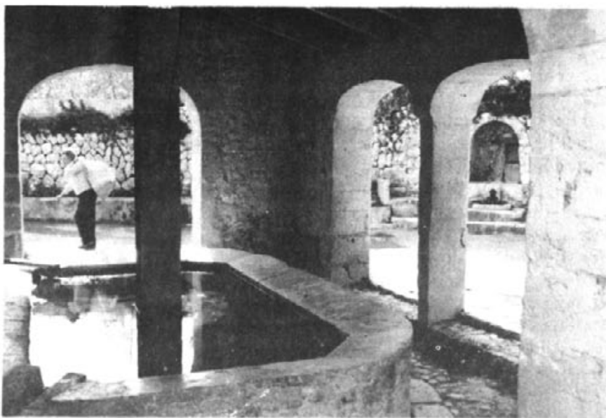
Fotografia de José Fernández Ventura

tor Pol Capó, de fotografies de temes locals de José Fernández Ventura, les quals sorprengueren a bastants que a Mancor hi hagués reconts tant bonics, i la de fotografies, participant al Primer Concurs de fotografia per aficionats