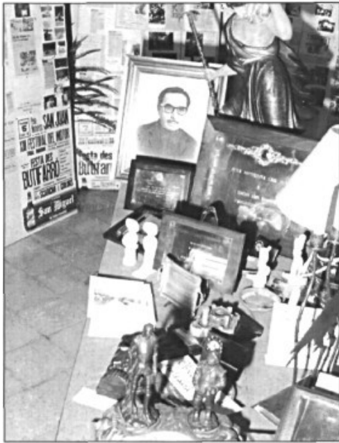
L'exposició que la Peña Motorista a duit a terme en el seu quaratè aniversari ha permès recordar molts de llocs i situacions que els santjoaners havíem oblidat.

d'Educació i Ciència i que ha de costar inicialment cinquanta milions, vuit dels quals han de sortir de les arques municipals. També esmenta el circuit cicloturístic del Pla, altrament conegut com «circuit cicloturístic pels pobles del Pla governats pel PP», ja que té la curiosa virtut de travessar el Pla esquivant tots els pobles governats per altres partits (això vol dir que no toca Sineu ni Vilafranca ni Petra, per posar tres exemples). El nostre batle és comprensiu i diu que ja els tocarà... qualche dia, i que evidentment no els discrimina ningú (al cap i la fi, havien de començar per qualche banda, i res més natural que començar pels companys de partit). Un altre tema és el del teatre, que ja fa vint anys que és un caramull de cendra. El batle anuncia gestions amb el Bisbat, propietari del solar, per desbloquejar la qüestió. Una espina que el batle té clavada és l'avortat circuit pedestre (una obra faraònica d'utilitat i necessitat més que dubtoses) per al qual no s'han aconseguit les subvencions sol·licitades al Consell Insular.