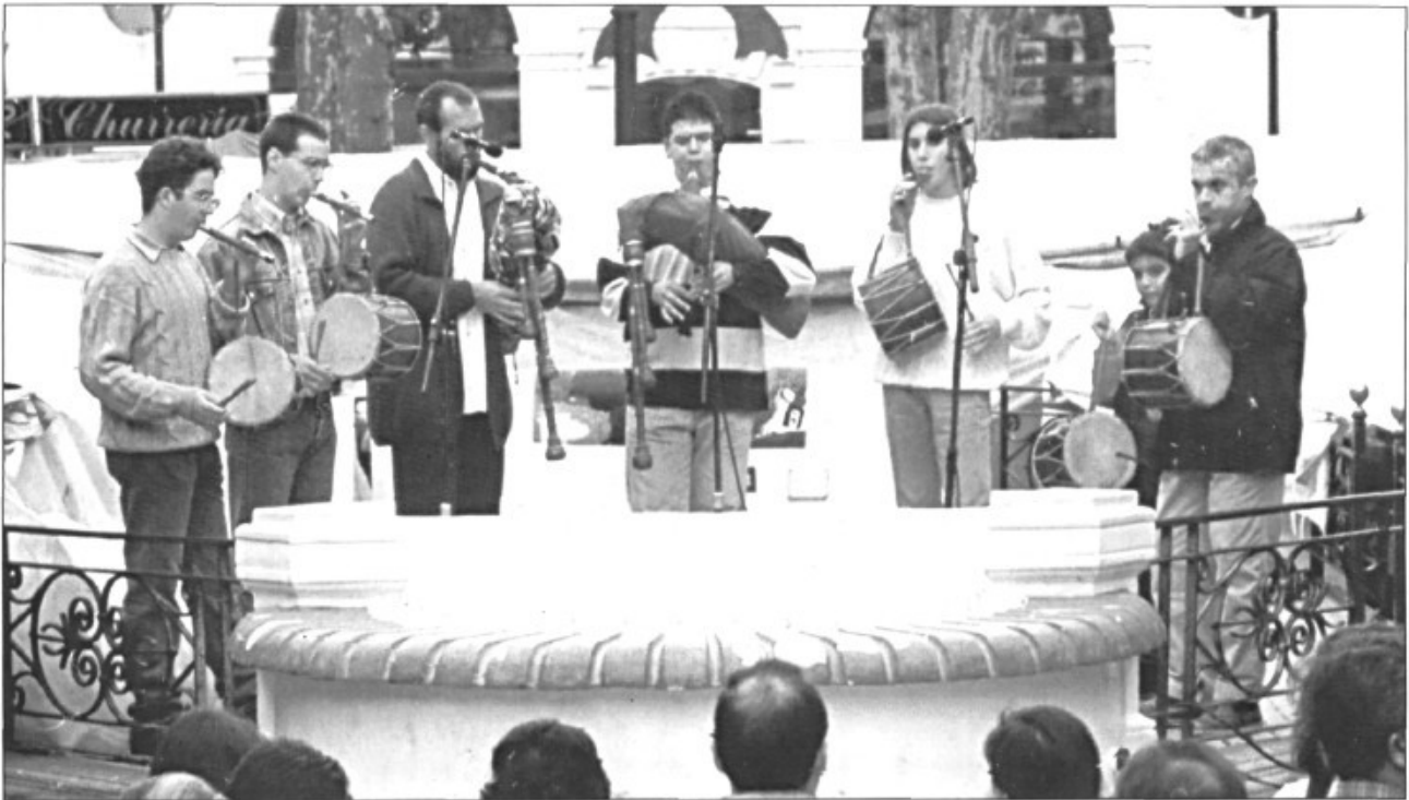
Els xeremiers de Sant Joan durant la seva actuació a la plaça de Muro.