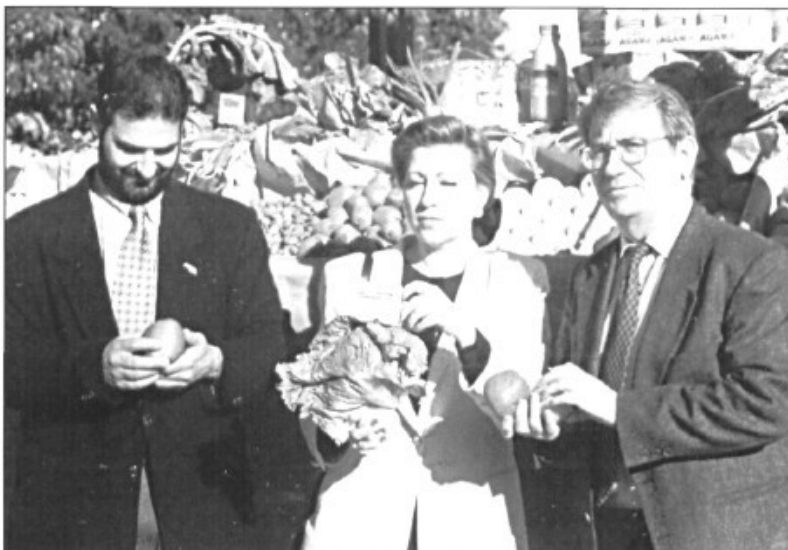
La Unió de Pagesos i el Consell Insular de Mallorca presentaren la campanya «Consumeix productes de la nostra terra» en el marc de la Fira de la Perdiu.

La Unió de Pagesos de Mallorca, amb el patrocini del Consell Insular de Mallorca, ha promogut la campanya «Consumeix productes de la nostra terra». L'objectiu és convèncer la gent que els productes fets a Mallorca (hortalisses, vi, formatge, fruita, fruites seques, carn i embotits) no tenen res a envejar als importats. Els productes autòctons tenen l'avantatge d'arribar ràpidament al consumidor, amb un mínim de manipulacions, i d'estar sotmesos a un màxim de garanties sanitàries.