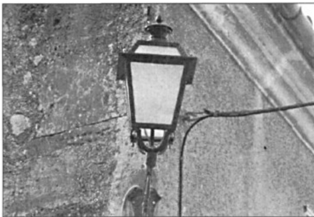
El batle va dir que des de l'Ajuntament es continua fent feina en la millora de l'enllumenat públic.