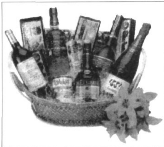
Si qualcú no ha rebut la panera que passi ràpidament pel nostre magnífic Ajuntament.