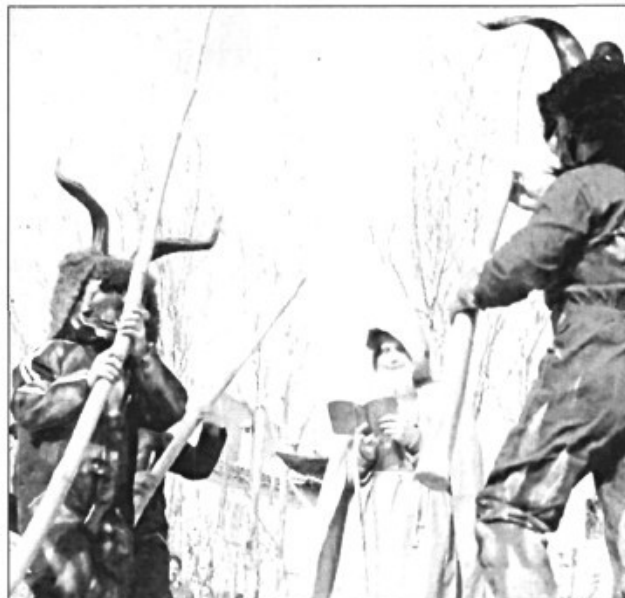
Per Sant Antoni Mallorca és una festa encesa.

Sant Antoni ses sabates (no en duien) les mos poríeu deixar perquè anit hem d'agafar un gat que no agafa rates.