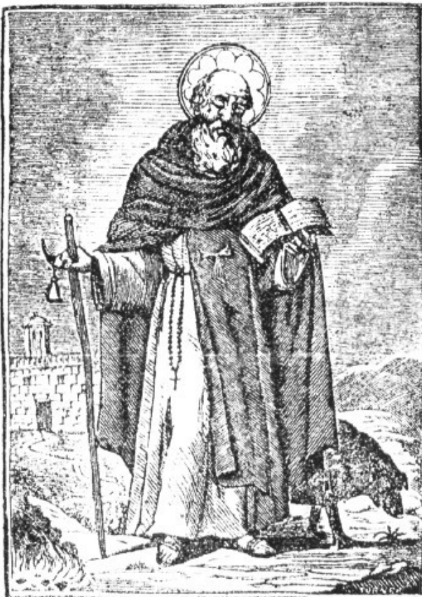
Sant Antoni de Viana.

— Que no sap per quin sant a vingut a predicar aquí? Si vostè ha de predicar així, pot tornar-se'n a ca seva. Vostè no ha dit res des meu sant.