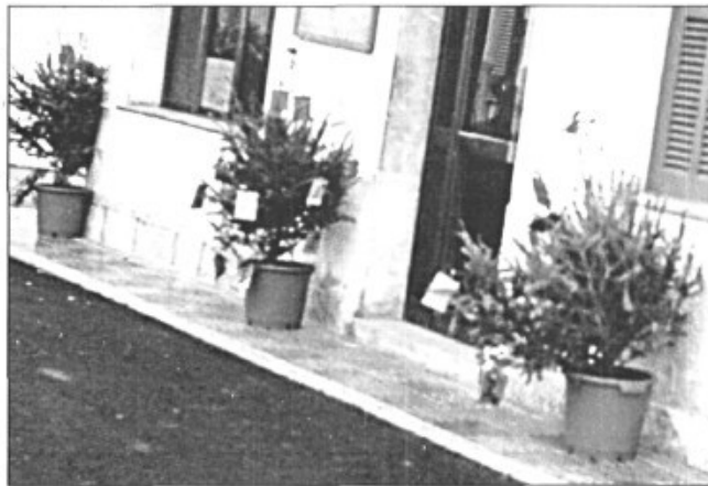
La PIMEM ha tengut la bona pensada d'adornar els locals dels seus associats amb un arbre de nadal.