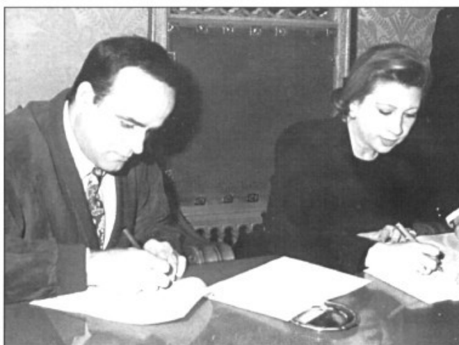
Els dos presidents signaren el nou conveni de col·laboració.

✓ L'Associació de Premsa Forana de Mallorca ha signat un conveni amb la Presidència del CIM, en què s'estableixen les ajudes que el Consell donarà a les revistes foranes. En relació amb això, a l'assemblea que l'APFM va celebrar dia 16 de desembre es va fer palès el malestar dels associats per l'escàs interès que les institucions demostren envers la premsa forana.