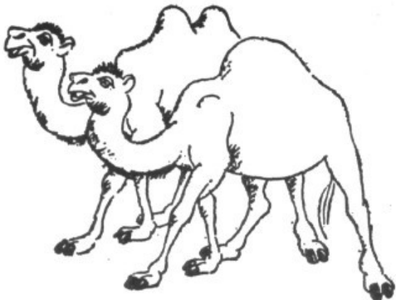
CAMELL I DROMEDARI

¿És el dromedari o el camell, senyors? ¿Quin, de l'un o l'altre, té un gep o en té dos?