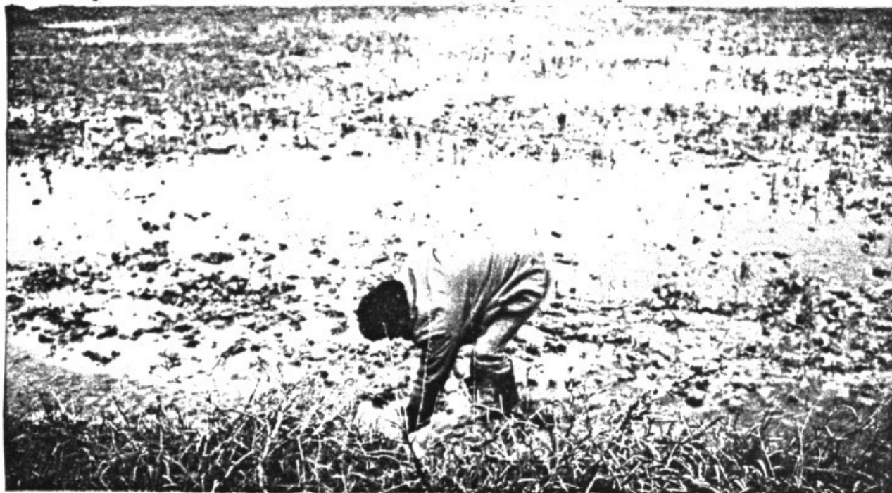
Tractau d'endevinar com han passat els temps lliure els pagesos durant aquests dos darrers mesos degut a les inundacions. Quan ho hagueu endevinat, mirau d'esbrinat qui és el que surt a la fotografia, i de qui és l'amo del bocí.

VERTICALS. - 1.- Nom de dona. Serpent enorme no verinosa. 2.- óicageN. Acció de vendre una cosa que s'ha comprat. 3.- Peça de forma ovalada que amb el seu moviment de rotació excèntric permet transferir un curt moviment lineal a una altre peça. Conjunt de persones, animals o coses. 4.- Punt de l'horitzó per o surt l'astre Rei. Està així com toca, així com ho volem. 5.- Ela Te E. En llenguatge col.loquial designa un lloc determinat, especialment petit, al revés. 6.- Un dels tres Reis Màgics de l'Orient. Vocal. 7.- Vocal rodona. cidòS rurolC. Faig consideracions que expliquen, justifiquen alguna cosa. 8.- República Democràtica Alemanya. Que té poc gruix. Consonant. 9.- Nom d'una famosa princesa contemporània. British ___ Lines. 10.- El primer de cada coll. Mantenir-se cert espai de temps a un mateix lloc.